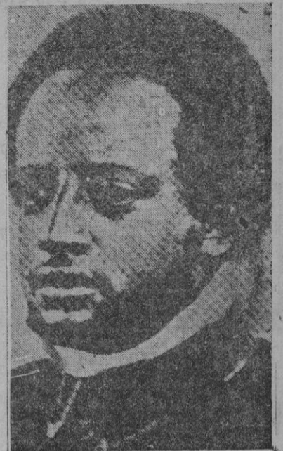
El ras de Tigré, descendiente del Negus Juan y aspirante al trono de Etiopía, que con 500 hombres se ha pasado a los italianos

*** A la salida de la plaza: --Hace mal Jaimito en tomar la alternativa. --¿Pero es que la va a tomar?