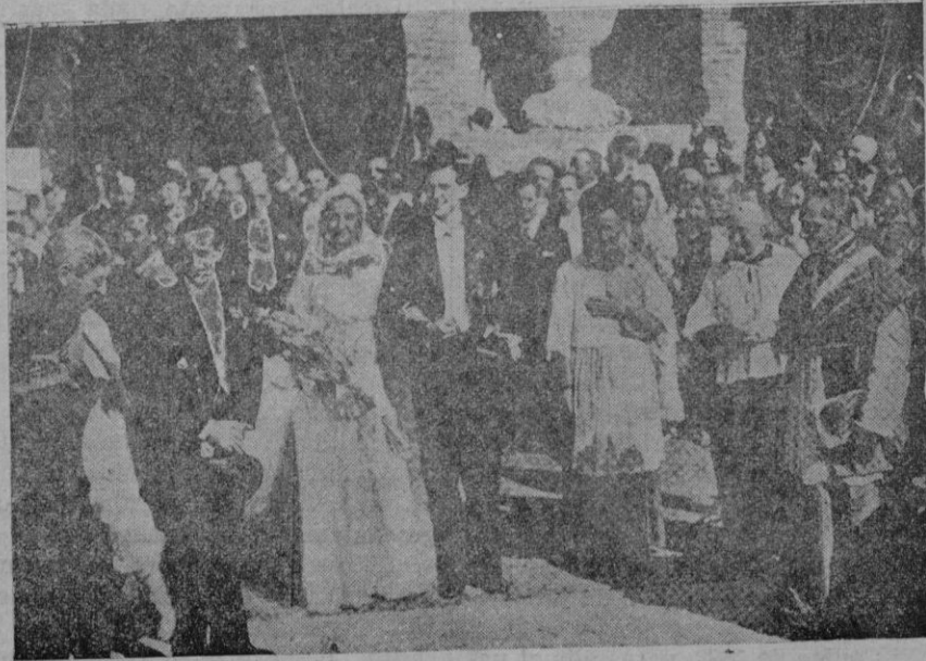
La boda de D. Juan de Borbón. -- Los novios al salir del templo

El Sr. Ferrer Arbona agradeció la expresada manifestación de gratitud en nombre propio y del personal del Municipio que cooperó tan eficazmente a la extinción del fuego.