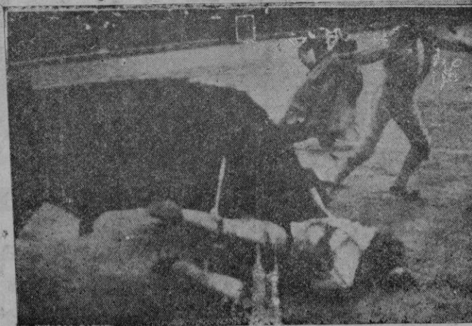
Grave cogida del banderillero Marzal en Valencia

Descendientes de segundo grado y posteriores, la escala, con los mismos grados, desde 1 por ciento al