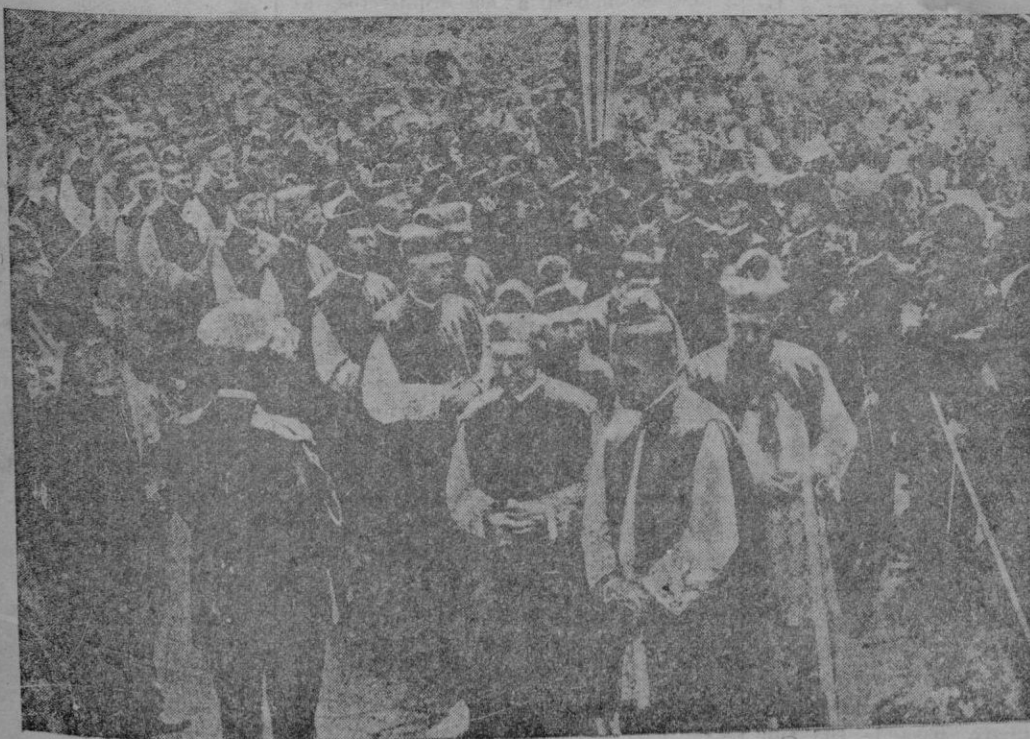
En la ciudad de Cleveland (EE. UU.) se ha celebrado un Congreso Eucarístico, presidido por el cardenal de Nueva York. Los obispos de los Estados Unidos dirigiéndose a la catedral

Se practican las diligencias del caso para la detención del autor.