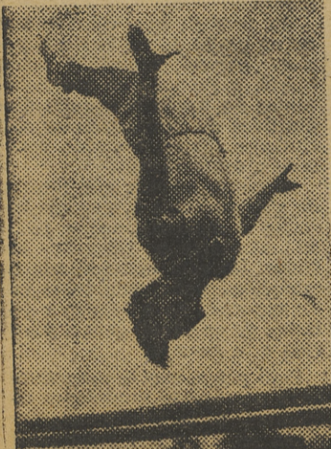
He aquí un arriesgado y difícil ejercicio en las paralelas, uno de los más bellos y espectaculares en las pruebas de gimnasia deportiva

Otro Campeonato de España en nuestra ciudad. Ahora los de gimnasia deportiva y levantamiento de peso, que tendrán lugar el próximo sábado y domingo en el Gran Price. Nos habla sobre esta modalidad, poco conocida entre nos-