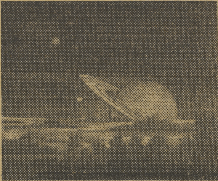
El planeta Saturno, visto desde uno de sus satélites, en el momento de ponerse

Pero puede que la naturaleza haya perseguido finalidades diferentes. Si la inteligencia humana es el punto culminante de la vida terrestre, la adaptación perfecta del instinto entre los insectos altamente especializados puede que sea la finalidad del trabajo de la naturaleza marciana.