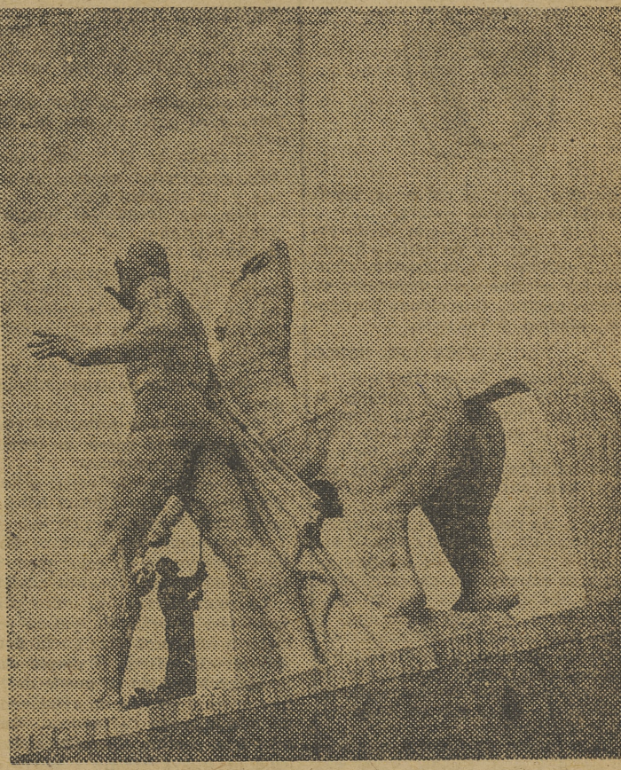
He aquí uno de los colosales grupos escultóricos que adornan uno de los edificios construidos en Roma para la Feria Internacional que debería haberse celebrado en 1942. Mide 25 pies de altura y pesa 120 toneladas