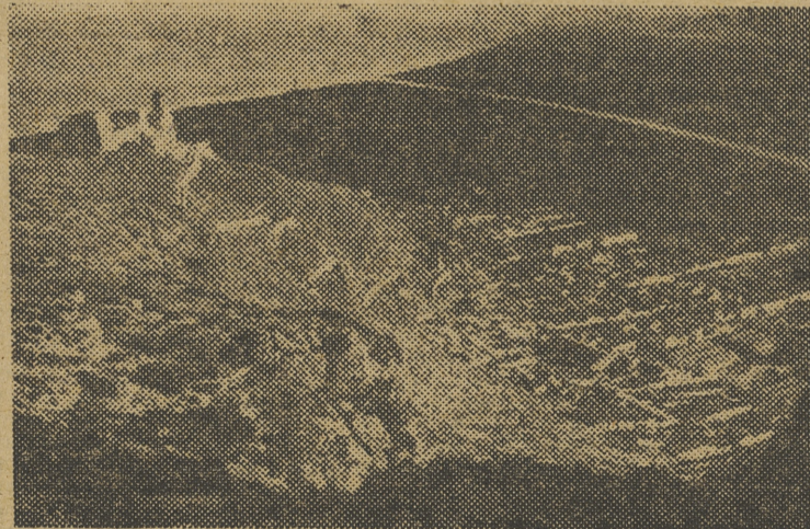
Vista panorámica del castiello y la ciudad (F.O. IAK)

Del 19 al 27 de abril, ambos inclusive, celebrará Cullera sus grandes fiestas cívico-religiosas en honor de la Patrona, Santísima Virgen del Castiello.