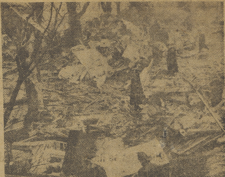
JAMAICA (Nueva York). — Estado en que quedaron las inmediaciones de una casa contra la que se estrelló un avión bimotor norteamericano. En total hubo que lamentar cinco muertos y veinticuatro heridos.