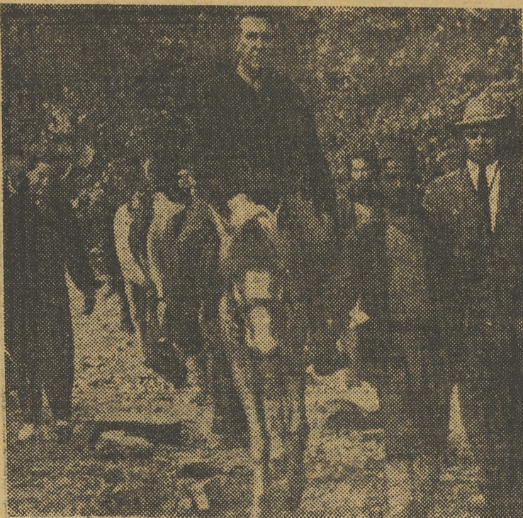
El embajador de los Estados Unidos en la India, Chester Bowles, nombrado también embajador en Nepal, atraviesa, con su hija, el Himalaya, para ir a presentar sus cartas credenciales al rey Tribhubana