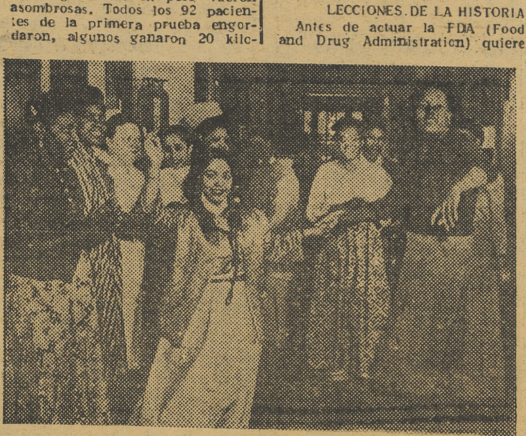
Las enfermas del Hospital Sea View, que parecían condenadas a muerte, ya en curso de curación, después de haber tomado la maravillosa droga, bailan ante los fotógrafos, como demostración de haber recuperado la salud

gramos en tres meses. Al principio los médicos se preocuparon creyendo que la ganancia experimentada fuera una no saludable acumulación de agua, pero con unas pocas excepciones esto no sucedió. Pacientes que habían tenido que guardar cama durante meses se sintieron tan fuertes que pudieron pasar por los jardines. Con las limitadas facilidades de laboratorio de un hospital de ciudad, los médicos de Sea View estaban intentando valorar los progresos médicos de sus pacientes, cuando Squibb and Sons dió su Nydrazid a los médicos del hospital de Nueva York. Allí, aunque los enfermos con tuberculosis avanzada eran escasos, las facilidades de laboratorio eran enormes. El doctor Walsh Mac Dermott empezó a trazar pruebas bioquímicas sobre el Nydrazid y pronto hizo un importante descubrimiento: aunque se tragaba como una píldora (menor que una tableta de aspirina), pronto aparecía la sustancia en el líquido cefalorraquídeo en "buena concentración". Esto significaba que podría ser extraordinariamente útil en la tuberculosis meníngea. Otras pruebas hicieron recomendable el Nydrazid para la tuberculosis miliar.