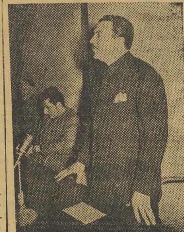
El nuevo secretario local, durante su intervención

el político, y que consiste, esencialmente, en coordinar la labor que llevan a cabo los distritos, puestos de avanzada en la capital, como verdaderas arterias por las que la Falange vierte sus consignas. Finalmente,