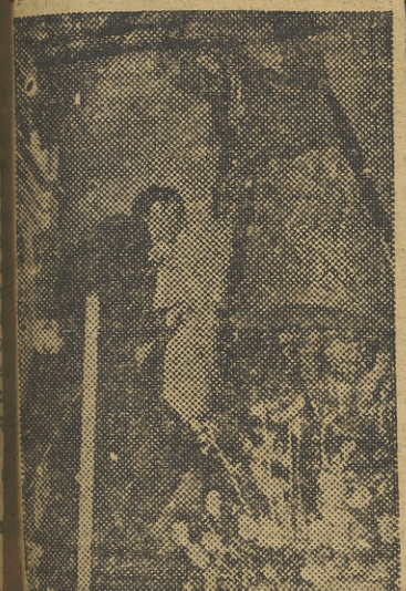
Uno de los primeros actos del señor Ruiz Jiménez, en su primera jornada valenciana, fué el piadoso besamanos de nuestra Patrona, la Virgen de los Desamparados.