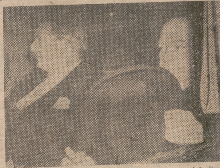
El primer ministro británico y su ministro de Asuntos Exteriores, dirigiéndose a la Embajada británica en París, después de haberse en revistado con Plevin, el jefe del Gobierno francés