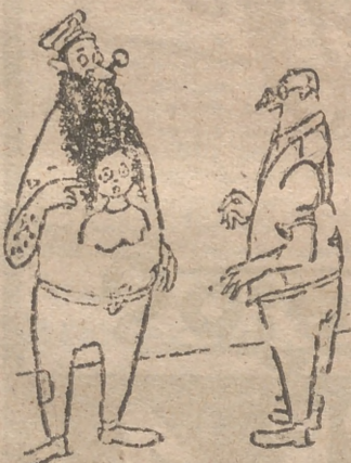
TATUAJES. —No hace falta que la haga usted el pelo.

—De ningún modo. Te lo debo y te lo he de pagar. Ahora, si tú quieres hacerme un regalo, dame otros quinientos pesos.