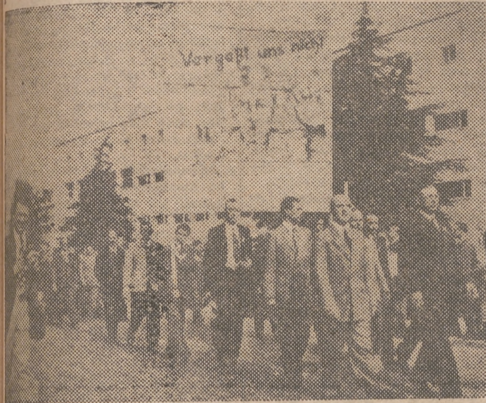
3.500 alemanes que fueron prisioneros de los rusos han desfilado silenciosamente por las calles de Berlín en una demostración para reclamar la libertad de cen enares de millares de alemanes todavía prisioneros de los comunistas, llevando carteles en los que podía verse un soldado prisionero con la leyenda "No me olvidéis"