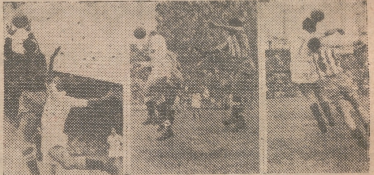
El juego aéreo en Mestalla es el preferido. Quizás influya el mal estado del terreno; quizás, que los medios no entregan como uno quisiera. Lo cierto, es que estas escenas tras el balón por el aire son las más frecuentes.