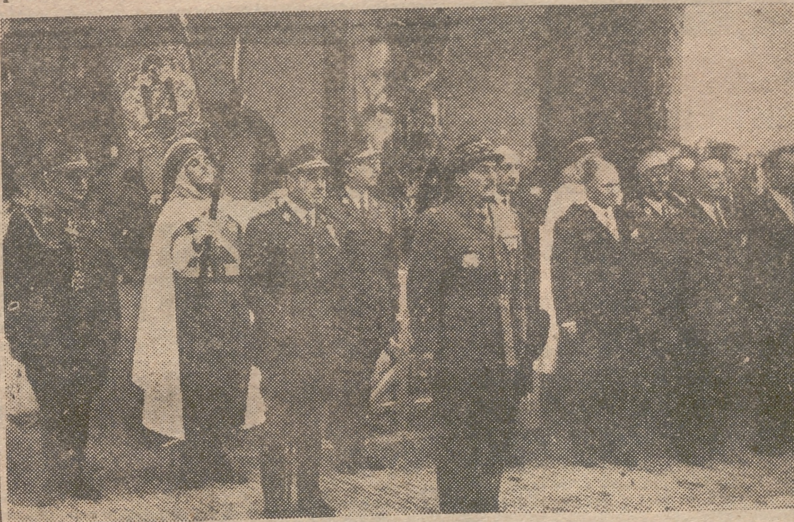
Larache.—El alto comisario español, teniente general García Valiño, y el residente general francés, general Guillaume, presencian el desfile de las fuerzas españolas que rindieron honores antes de su entrevista para la adopción de una actitud común respecto a los nacionalistas marroquíes.