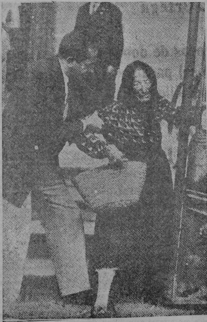
El Ayuntamiento de Madrid ha acordado la supresión de la mendicidad callejera. — Momento de ser recogida una mendiga, para conducirla al Asilo