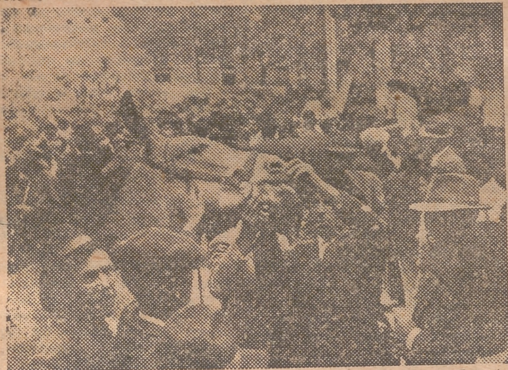
Examinando una caballería en ple no trato.

Las yeguas de tipo corriente, de 1,50 metros de alzada, de 7.000 a 9.000 pesetas; potros de un año, de 3.000 a 5.000 pesetas; caballos corrientes, de tres años y 1,47 de alzada, de 7.000 a 9.000 pesetas. — M. A.