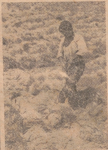
Esparto blanqueándose al sol

Las aplicaciones que permite el esparto son numerosas, ya que se emplea para fabricar sogas, sin preparación alguna, después de soleado durante ocho o diez días, o sufre diversas preparaciones adecuadas, según al fin que se le destinan, confeccionándose alpargatas, es-