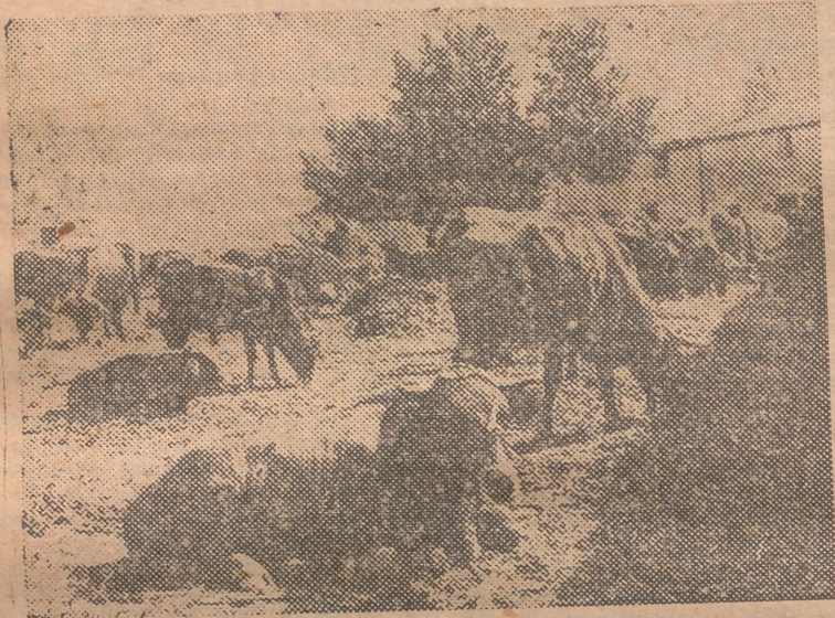
Ganado vacuno en una feria castellana.

Durante el mes de septiembre han acusado escasa animación