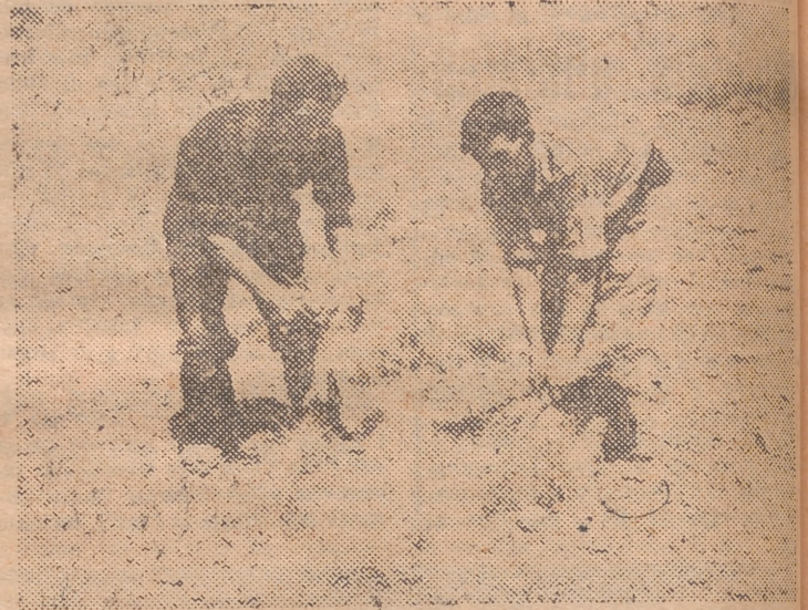
Arranque de esparto.

lancia, basta decir que en Inglaterra esta industria consume más de 300.000 toneladas de esparto, importadas de Túnez, Argelia y España. liones de pesetas. A esta cantidad hay que añadir el importe de los salarios, transportes, contribuciones e impuestos, gastos generales, rentas y beneficio que asciende a 286 mil millones de pesetas.—MIGUEL ANGEL GEL.