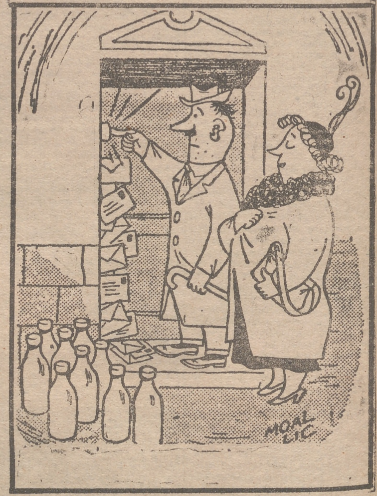
—¡Es raro! No contesta nadie... (De "L'Illustré")

HORIZONTALES: 1. — SACO, 2. — PECORA. 3. — LICOROSO. 4. — LAT. SOPAPO. 5. — ATOM. EDEN. 6. — CONO. ALURC. 7. — ASILOS. RAE. 8. — ASEGURAR. 9. — AREMOS. 10. — APES. VERTICALES: 1. — LACA. 2. — LATOSA. 3. — PITONISA. 4. — SEC. MOLERA. 5. — ACOSO. 6. — CORO. ASUME. 7. — OROPEL. ROS. 8. — ASADURAS. 9. — OPERAR. 10. — ONCE.