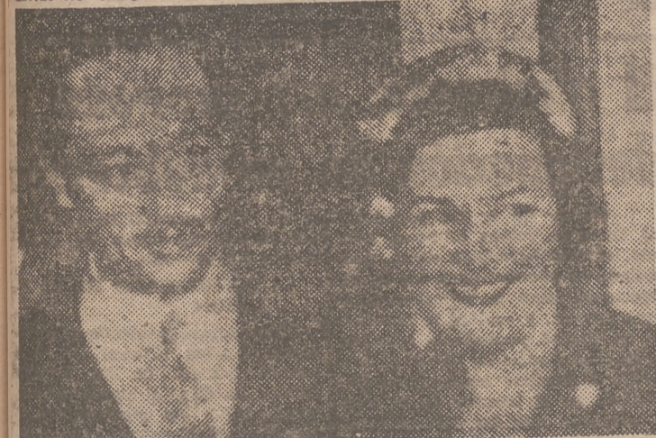
Presentamos a nuestros lectores esta foto retrospectiva. En ella aparece Imperio Argentina y el conde de las Cabezuelas, saliendo del templo donde se celebró la ceremonia nupcial. Meses más tarde, esos rostros sonrientes...

La prensa argentina sigue ocupándose todavía del desgraciado matrimonio de la actriz española Imperio Argentina con el conde de las Cabezuelas. Como ya informamos a nuestros lectores, el enlace se celebró hace poco más de un año, en Buenos Aires. Y meses después leíamos el final de este breve romance sentimental. Leemos unas declaraciones hechas recientemente por el conde de las Cabezuelas. Para él, la novela de amor no ha terminado todavía. No hace muchos días dijo