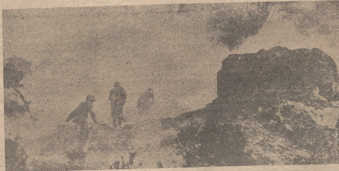
Las operaciones militares en Corea, aunque a ritmo más lento, no se han paralizado, a consecuencia de las conversaciones de Kaesong. La foto muestra una patrulla norteamericana durante un reconocimiento en las cercanías de Pyonggang