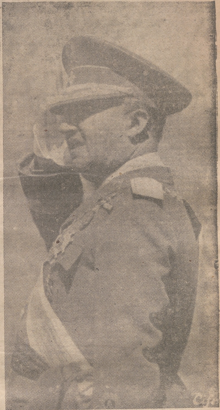
Francisco Franco Bahamonde, Caudillo providencial de la Patria, no sólo constituye el exponente más alto de las virtudes militares de la raza, sino que es, además, el primer trabajador de España. En la punta de su victoriosa espada brilló en todo momento la luz de la suprema verdad, y él supo hacer algo más difícil que justificar la guerra: dar gloria a la paz, a través de unas realizaciones sociales innumerables, audaces y cristianísimas. Por eso vuelve de nuevo a presidir su imagen nuestra primera página, como el mejor símbolo de esta gran efemérides del 18 de Julio, Fiesta Nacional del Alzamiento y del Trabajo. Porque él cifra, además, toda nuestra fe y toda nuestra ilusión de españoles nuevos con memoria del pasado, entendimiento del presente y voluntad de futuro.