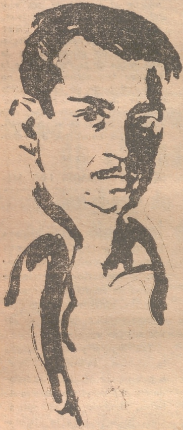
Autorretrato de Hernández Mompó

A finales del pasado año regresó de París, a donde fué pensionado. París es el sueño de todos los artistas. Por lo menos, llegar hasta él y medir fuerzas para el posible logro de las justas ambiciones.