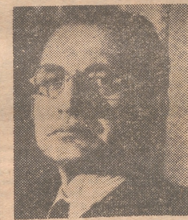
DE GASPERI Un triunfo agri dulce

Peró el triunfo se convierte en derrota si se compara con las elecciones legislativas de 1948. Entonces, los demócratas cristianos, ayudados por la recuperación económica, debida al plan Marshall, y por una voluntad decidida de todos los elementos anticomunistas, obtuvieron la mayoría absoluta en el Parlamento. Pero ahora han perdido terreno, en relación al número de votantes. En 27 capitales de provincia los comunistas y aliados han obtenido el 37 por 100 de los votos, mientras que en 1948, tuvieron el 34,3 por 100. Por el contrario, los demócratas cristianos han descendido de 43,3 por 100 a 36,5 por 100. Y una de las causas de que la coalición anticomunista haya conquistado a los comunistas aquellas ciudades, es la nueva ley electoral que concede a la alianza de partidos