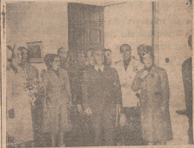
LAS NAVAS DEL MARQUES.— S. E. el Jefe del Estado, acompañado de su esposa, secretario general del Movimiento, delegada nacional de la Sección Femenina y otras personalidades, visita las dependencias del castillo durante su estancia en el mismo, para proceder a la inauguración de la Escuela de Instructoras “Isabel la Católica”.