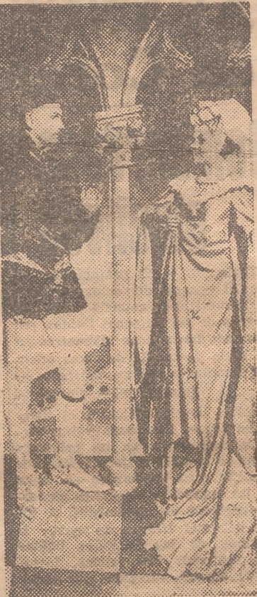
Una escena de la película inglesa "Enrique V" la gran película que dirigió e interpretó Lawrence Olivier, gracias a la colaboración de sir Arthur Rank

tan tardía vocación reside en su dinero —buen trampolín para los negocios cinematográficos— y en su espíritu religioso. Mr. Rank es, en efecto, metodista. Se puede afirmar que sin su dinero, sir Arthur no hubiese podido hacer películas y que sin su metodismo, no hubiese querido hacerlas. El virtuoso capitalista funda, pues, una pequeña compañía de producción dedicada exclusivamente a la realización de películas religiosas. Muy pronto, sin embargo, se extiende y se "comercializa" el campo de sus actividades cinematográficas. Pocos años después, en efec-