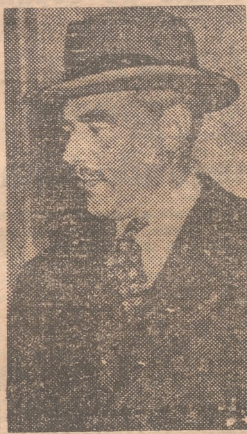
ACHESON Donde dije blanco...

Pero no se detiene aquí Acheson; por otras declaraciones, éstas ante la comisión senatorial que investiga la destitución de MacArthur, nos enteramos de que la