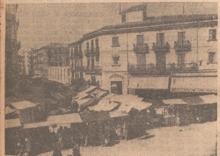
Las lonas de las "paradas" de venta semejan, desde lo alto, un pequeño poblado árabe, bañado por el sol

filosofía especial, propia, que les hace ver las cosas de un modo distinto a todos los demás. Por eso es bueno frecuentar su trato, seguros de que su compañía ennoblecen nuestra propia personalidad. Tratemos de averiguar lo que ellos quieren y piensan.