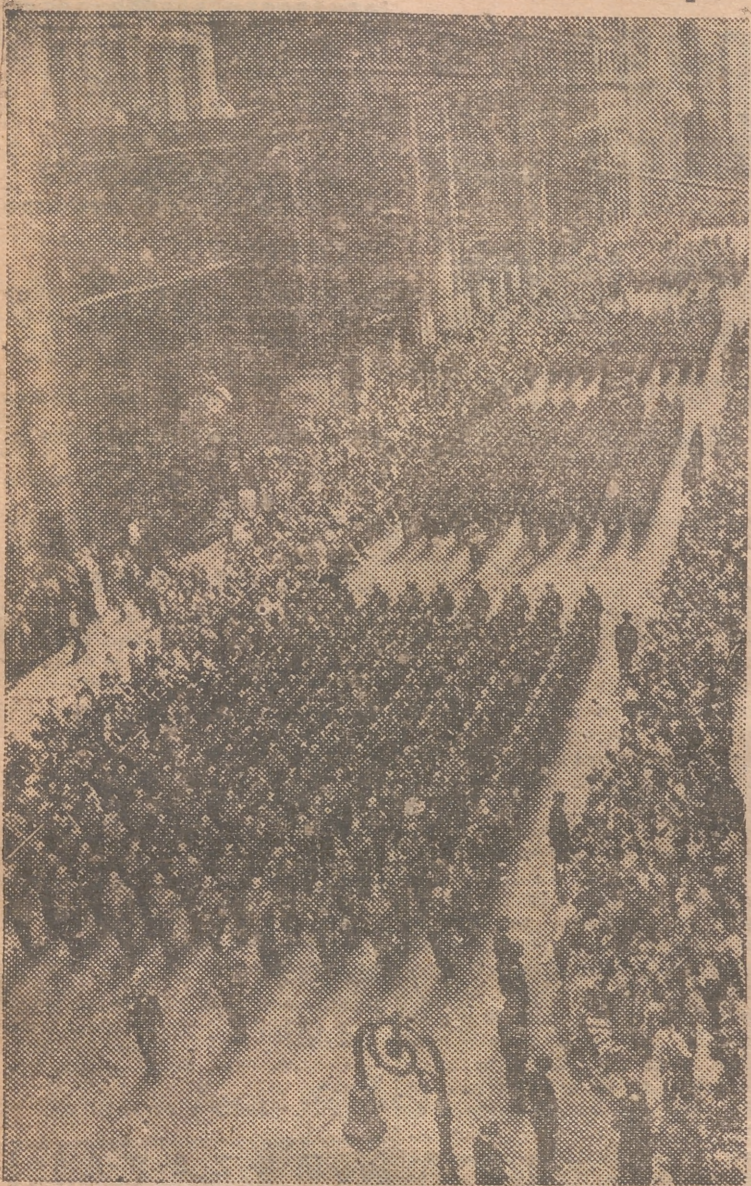
NUEVA YORK.—Un aspecto del desfile, por una calle neoyorkina, de los soldados de infantería que marchan a Europa, donde permanecerán bajo las órdenes del general Eisenhower, para reforzar el pacto del Atlántico.