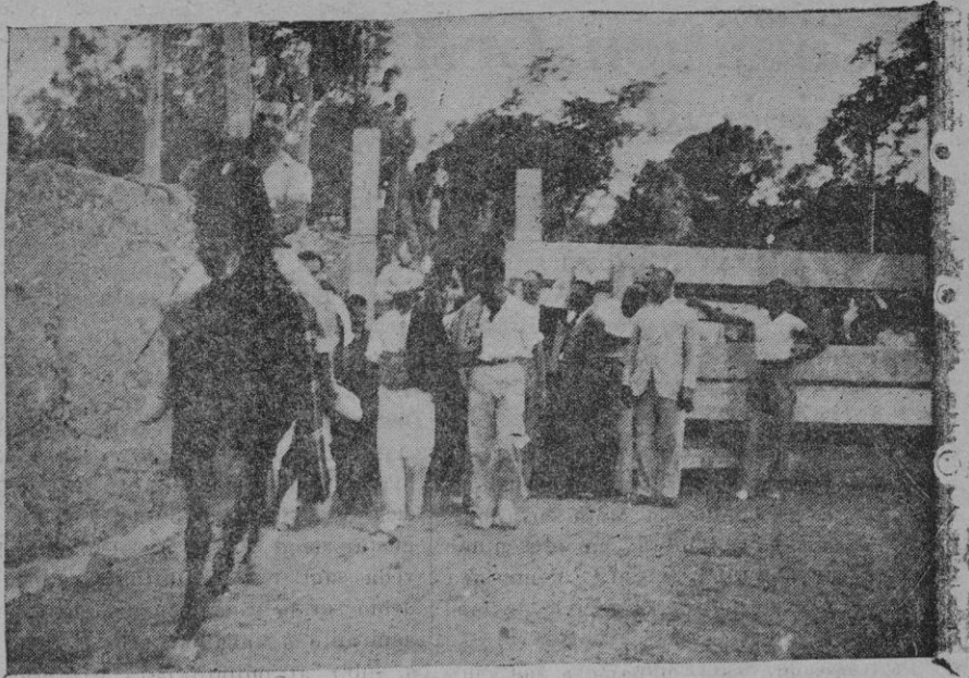
Un aspecto de las fiestas celebradas el domingo en Son Rapinya

La señorita Clar y el señor Humbert, como siempre poniendo cátedra, y el "veterano" de Inca y su