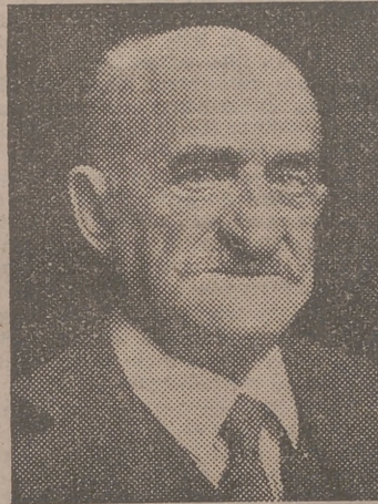
Don Alvaro de Figueroa, conde de Romanones, que falleció ayer, en Madrid, a la edad de 87 años

Desde primeras horas y tan pronto como se conoció la noticia del fallecimiento, comenzó el desfile de público de todas clases sociales por el hotel de la Castellana, llenándose de firmas los pliegos colocados en los jardines de la finca, con toda rapidez. Las misas también se vieron concurridísimas de aristócratas, amigos incondicionales del conde de Romanones y gente de clase modesta. La condesa de Romanones fué saludada por infinidad de señoras que desfilaron por la capilla ardiente.