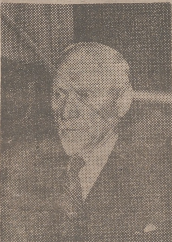
El mariscal Smuts, ex presidente de la Unión Sudafricana, que ha muerto a los 80 años de edad

Santiago de Chile 12. — El Gobierno chileno ha rechazado las pretensiones soviéticas sobre derechos de Rusia en la Antártida, según una declaración facilitada por el Ministerio de Asuntos Exteriores. — Efe.