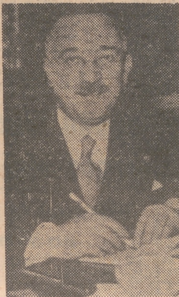
QUEUILLE Lo que dura una rosa

ble más que gobiernos sostenidos por la coalición del M. R. P. de socialistas y de radicales. Los socialistas han derribado ya los cinco gobiernos últimos, todos ellos parecidos, como una gota de agua a otra. Se dice que había una guerra secreta y personal entre Bidault y ciertos altos directivos socialistas, pero si esto puede ser verdad en este caso, no explica las cuatro crisis anteriores. La verdad es que como hemos dicho, los socialistas no saben si comportarse como un partido marxista o como un partido burgués avanzado. Si hacen esto último, los comunistas se llevarían casi todos sus afiliados, presentándose, como los