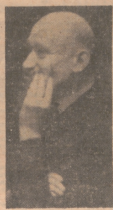
SCHUMAN Para ser neutrales hay que ser fuertes

Hay que convenir en que estos recelos tienen cierto fundamento y han nacido precisamente de ciertas corrientes de opinión que se han manifestado en Europa en los últimos tiempos. Por eso en los Estados Unidos se multiplican ahora las declaraciones de personalidades, para disipar los temores europeos, asegurando que el bloque occidental es mucho más fuerte que el comunista. Y aunque, por regla general, se ha dispensado buena acogida al plan Schuman, no ha faltado quien opine que si este plan prospera, Europa se fortalecería tanto que podría hacerse independiente de los Estados