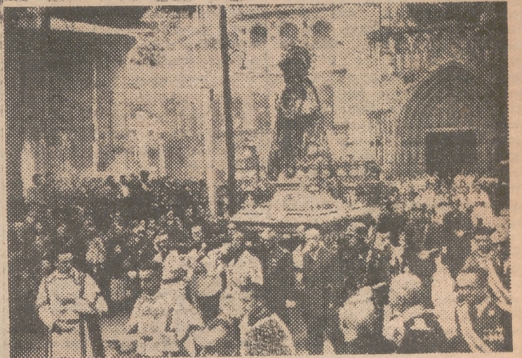
La Virgen a la salida de la Catedral en la procesión

Toda la ciudad estuvo representada en la procesión de la tarde