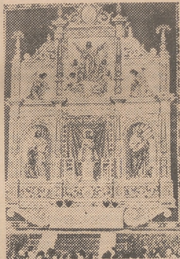
Tapiz del Altar de la plaza de la Virgen