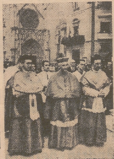
El señor obispo de Coria durante la procesión de ayer tarde

Seguidamente, formaban el Cuerpo de Bomberos; Caballeros ex cautivos y ex combatientes; Cuerpo de clarines y timbales de la ciudad; Banda municipal; Real Cofradía de la Virgen; Cruz catedralicia; Consejo Diocesano de Hombres y Jóvenes y Junta Diocesana de Acción Católica; alumnos del Seminario; señores invitados interpolados con los reverendísimos beneficiados; excelentísimos señores invitados interpolados con el ilustrísimo cabildo, entre los que figuraban el jefe de la 31 División, general Santapau; jefe de Estado Mayor, general Vallejo Nájera;