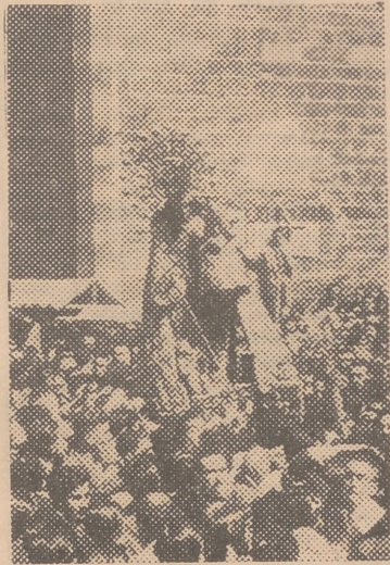
Un momento del Traslado

de Santa Cruz, seguida de la Asociación de "Adeljo"; niños de la Casa Beneficencia y Banda de música de esta institución; parroquia del Pilar, entre cuyos feligreses destacaba el antiguo gremio de maestros