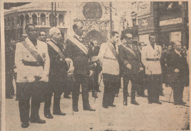
Las primeras autoridades en la procesión general

Valencia vivió ayer, una vez más, la inenarrable jornada de la festividad de su Patrona, la Virgen de los Desamparados. El fervor y el entusiasmo de los valencianos se desbordó en cuantos actos se celebraron, con esa incomparable emoción brotada a raudales de los pechos y las gargantas del pueblo católico. El traslado de la Virgen desde su