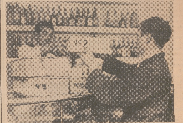
Medio millón de ostras se consumen en Valencia por año