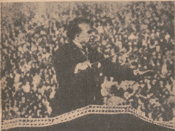
Mascagni dirigiendo en París uno de sus conciertos ante siete mil oyentes

Alabó siempre las melodías populares, entre las cuales, según decía, las más bellas eran las españolas, las italianas y las magyares. Opinando de Bach declaró que le tenía por el músico más moderno y el único que logró hacer caminar de acuerdo y al unísono los dos antagónicos componentes del hombre: corazón y cerebro.