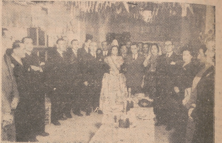
Durante las fiestas falleras, ha visitado nuestra ciudad el alcalde de Salamanca, señor Fernández Alonso. En la foto aparece, junto al gobernador civil de Valencia, señor Salas Pombo, visitando la barraca de la comisión fallera de las calles Salamanca-Condé Altea