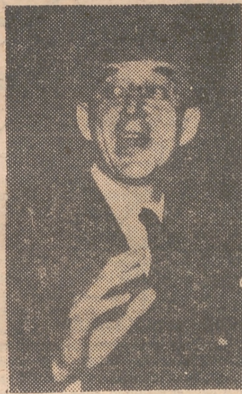
JESSUP La sospecha alcanza a todo el mundo

Pero ahora, hay que convenir, también, en que los medios puestos en práctica para extirpar esa infiltración no son los más adecuados. Las democracias que