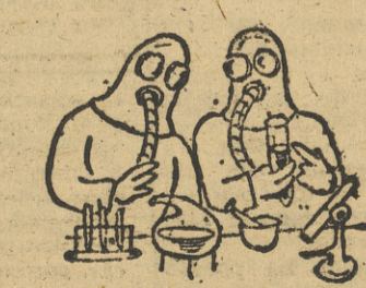
—Tenemos que volver a empezar los experimentos sobre radioactividad... Esto que nos ha resultado es vino tinto...

—Si, se ha quedado viudo. Ayer, jugando al ajedrez, se comió la reina.