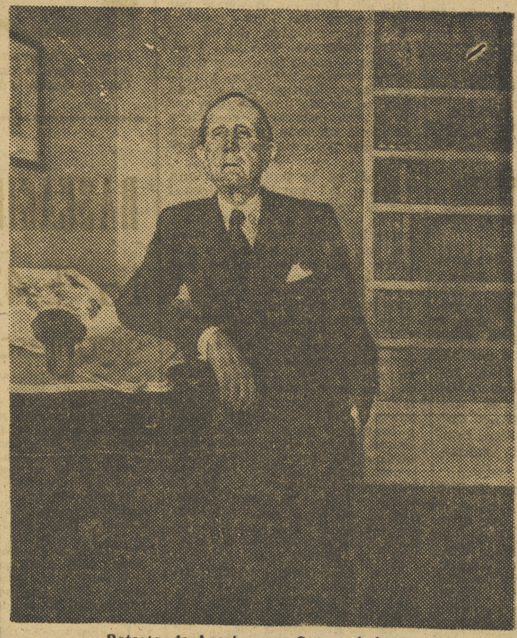
Retrato de Azorin, por Genaro Lahuerta

El arte de Genaro Lahuerta está en un momento interesantísimo de madurez verdadera. Hemos de convenir en que el calificativo «maduro» se prodiga con desahogado exceso. Apenas un artista deja a sus espaldas la adolescencia de su arte, ya le consideramos «maduro». Y no es así casi nunca. Entre la adolescencia y la madurez hay un largo período de vacilaciones, estudios y ritmos, que es el que ahora La-