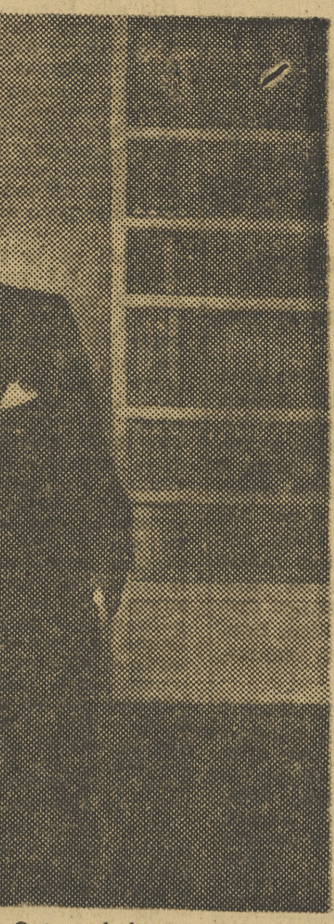
retrato propiamente dicho ceñtran y superan la sucinta ambientación.

rra y después de él está siendo adoptada por no pocos jóvenes. Sencillamente, ha creado escuela. La actual exposición cuya consta de veinte telas: retratos, paisajes y bodegones. Ya está dicho que el retrato de la señora viuda de Reig es, sin duda, obra destacada en el conjunto expuesto. También el de Pipe Alfaro y el de Azorin, nueva versión pictórica del gran escritor de Monóvar, en la que las excelencias del