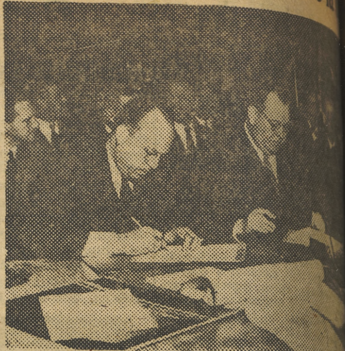
El secretario general de la O. N. U., Trygve Lie, en los momentos para la construcción del Secretariado, primer Cuartel General Permanente de las Naciones Unidas.