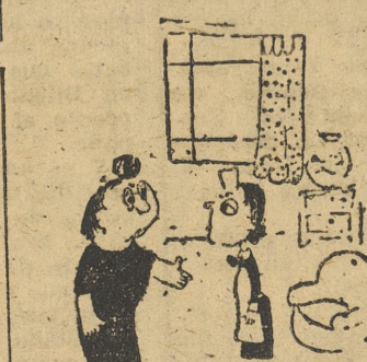
—Ha servido en muchas casas antes de venir aquí? —Sí, señora; pero de ninguna he salido por mi voluntad.