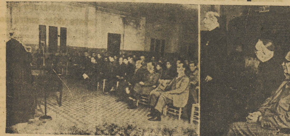
Con asistencia del señor arzobispo y del delegado provincial de Sindicatos, se celebró ayer, en el Grao, un acto misional para los obreros portuarios.