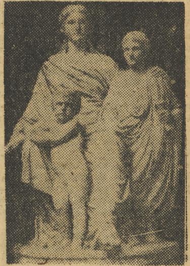
LOS GRACOS Un ejemplo para Cripps

Cayo Graco, recogiendo las ideas y las leyes de su hermano Tiberio, quiso salvar la economía romana y reorganizar el Estado. Proyectos en sí laudables, que son también la aspiración de los actuales laboristas. Pero en lo que aquél ya no estuvo tan acertado, fue en los medios que escogió. Sus proyectos fundamentales eran una ley agraria, especie de nacionalización de la tierra, de muy dudosos resultados, dada la competencia ruinosa del trigo de las colonias, y un proyecto de asentamiento de romanos en las colonias. Es cu-