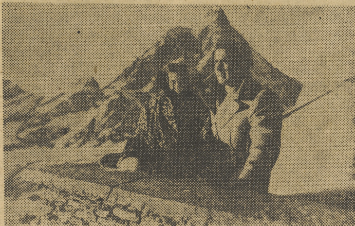
Tyrone Power y Linda Christian, los recién casados del cine americano, contemplan entusiasmados este paisaje fantástico de los Alpes italianos en Cervinia, donde pasan parte de su luna de miel

El palacio de El Viso será archivo de la Marina