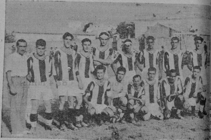
El Baleares que venció al Mallorca, se adjudicó el trofeo Casa Buades