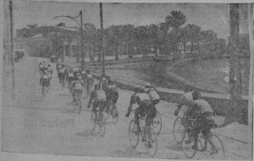
El pelotón pasando por el Portixol camino de S'Aranjassa

Puntuación de esta carrera: C. de R., 50 puntos. C. N. C. M., 10 id. C. N. P., 42 id. C. N. M., 3 id. Cuarta y última carrera, de relevos 5x33 libres: Primero, C. de R., equipo integrado