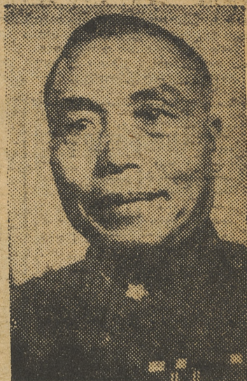
LI TSENG YEN

¿Indican estas noticias una ruptura de negociaciones o es que el presidente Li quiere obtener mejores condiciones y mostrar que todavía está en situación de combatir? Sin olvidar que hay en el lado nacionalista un fuerte partido de la