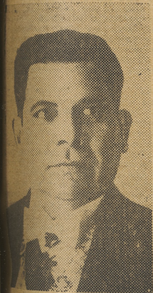
Juan González, presidente del Paraguay que ha sido depuesto, nombrando a la asamblea nacional, en su lugar, al general Rolón