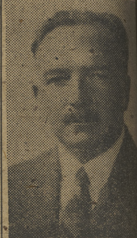
El señor Leo T. MacDonogh, nuevo ministro de Irlanda en España. — (Foto...)