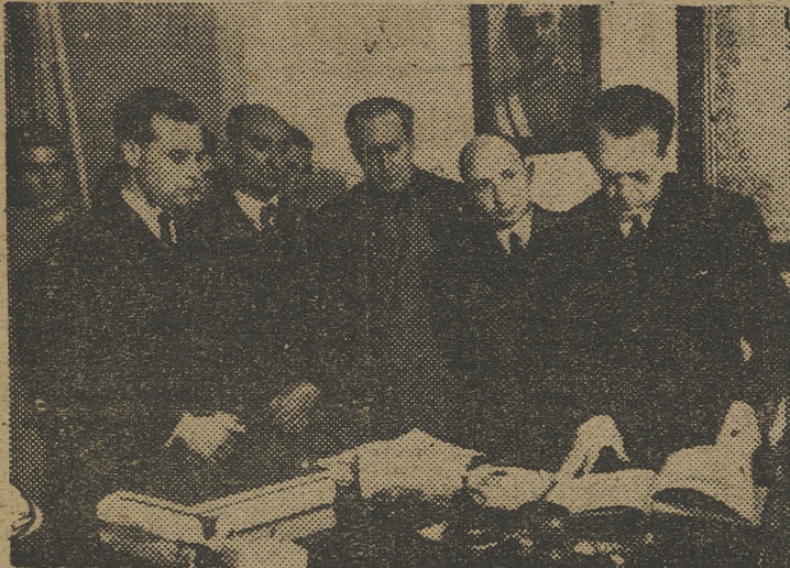
Un momento del acto celebrado ayer en la Jefatura Provincial.

al Partido. «Venís —dijo— gozosos del brazo de vuestro alcalde para dar un mentís rotundo a los que dicen y piensan que en la ciudad no se preocupan del trabajo que realizáis y de las inquietudes que sentís a cada instante. Estad completamente seguros de que en todos vuestros problemas ponemos el máximo de nuestro entusiasmo para resolverlos satisfactoriamente, ya que esta es la consigna de Franco, a quien todos los españoles debemos gratitud por cuanto está realizando en pro de los espa-