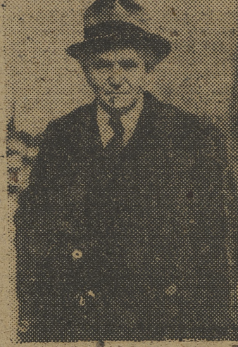
BEN GURION Éxito en todos los frentes

Israel es un pequeño Estado, un Estado apenas nacido y que lucha todavía por sus fronteras y por su reconocimiento. Sin embargo, tiene aliados de gran potencia, y la creencia en a habilidad y destreza de los judíos es tan extendida por todo el mundo, que se esperan de él grandes cosas. No cabe duda que en el Próximo Oriente ha surgido un país de aliados y envergadura muy diferentes a los de sus vecinos y que trastoca la tradicional política en aquellas regiones. De ahí la importancia del rumbo que tome el nuevo Estado y la importancia de las elecciones constituyentes celebradas el día 25. No es exagerada, pues, a declaración del primer ministro, David Ben Gurión, cuando dijo que serían dados a la publicidad los nombres de los votantes, como recuerdo histórico de quienes fundaron el Estado y modelaron su carácter. Aunque no es floja tal tarea, pues a lista electoral estaba basada en el