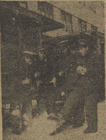
Un invierno sin lumbre, no sería invierno...

No hay que hacerse ilusiones. Muchos valencianos creyeron llegada la hora de volver a colgar los abrigos en el ropero, con unas bolitas de naftalina en cada bolsillo. Pero ha vuelto el frío. Han vuelto los gabanes a las calles, y de nuevo las gentes han puesto en práctica, con gesto deportivo la involuntaria gimnasia de la tos y el estornudo. Es para disimular. Porque aunque para estornudar se adopte una "pose" para