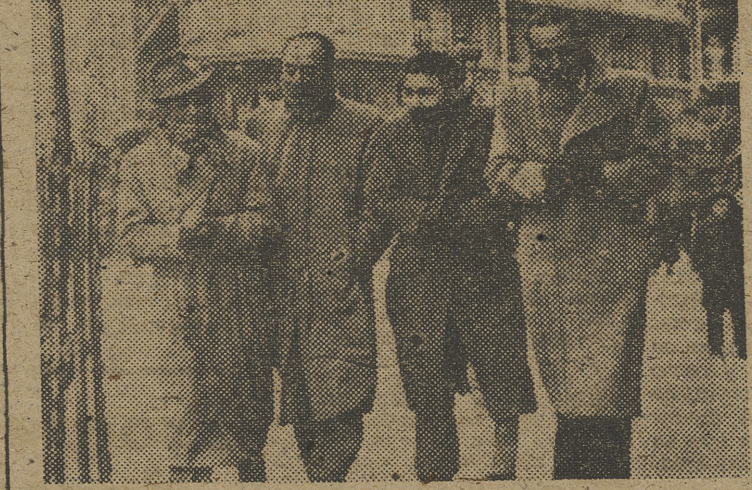
¿Abrigo? ¿Gabardina? Cuando hace frío hace frío...

Es cuestión de ordenanzas. En un período de tiempo determinado hay que llevar la capa puesta. Pero antes habrá que saber si el día es frío o no. Da igual. Como estamos en pleno invierno.