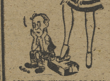
LAS SIETE MUJERES DE ADAN