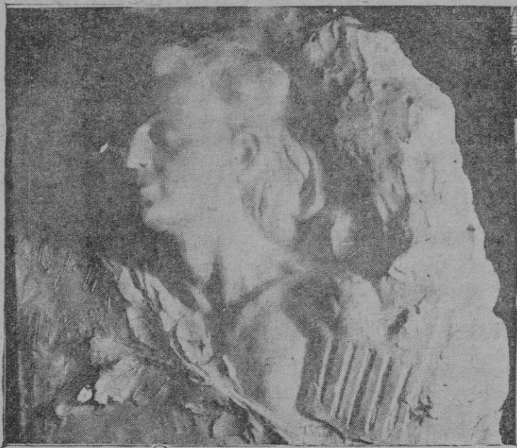
Busto para el monumento a Chopin, en mármol obra del escultor Vila. El pedestal es obra del arquitecto señor Forteza

que había sucedido en Wimbledon, — una vez esos “socios” se arrojaron a este último con los