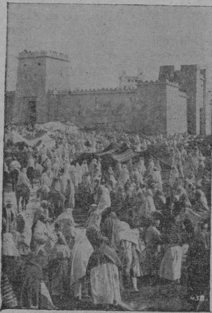
Escena de la gran producción religiosa “Gólgota”, exclusivas Huet, para la próxima temporada