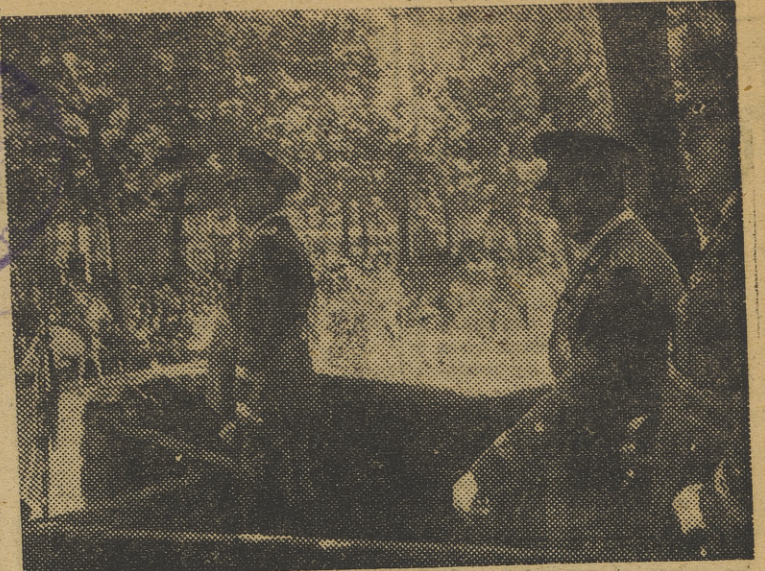
BARCELONA. — S. E. el Jefe del Estado presencia el gran desfile militar