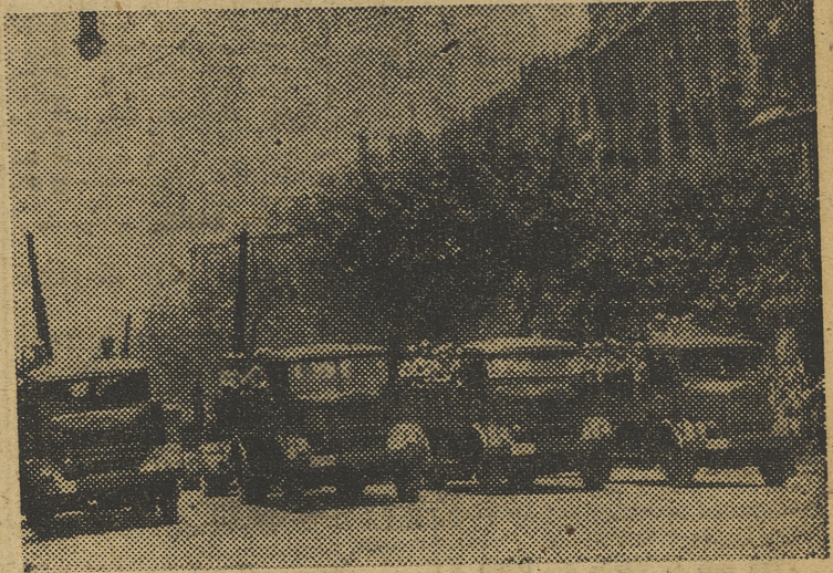
Un momento del desfile celebrado en esta ciudad y que fué presenciado por S. E. el Jefe del Estado