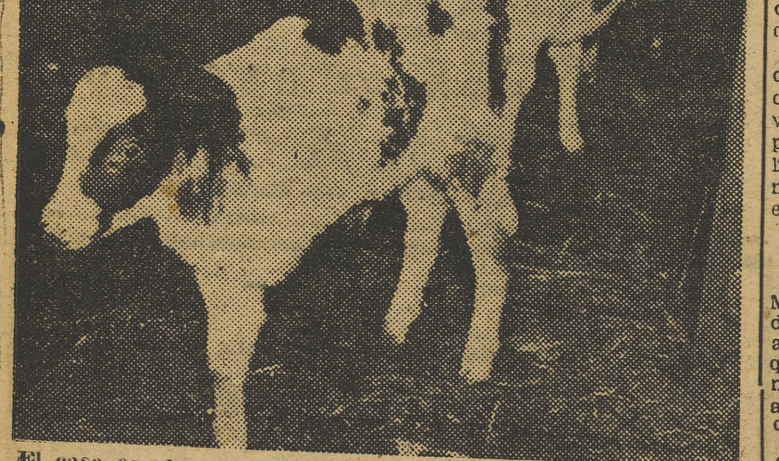
El caso es raro, pero se da de vez en cuando, y ahora que así ha sucedido, no queremos perdernos la ocasión de mostrárselo a ustedes en esta fotografía. En un rancho de Hillsdale, en los Estados Unidos, ha nacido este ternero completamente normal, a excepción de que sólo tiene una pata delantera. Corre y salta igual que todos los de su raza, sin embargo.