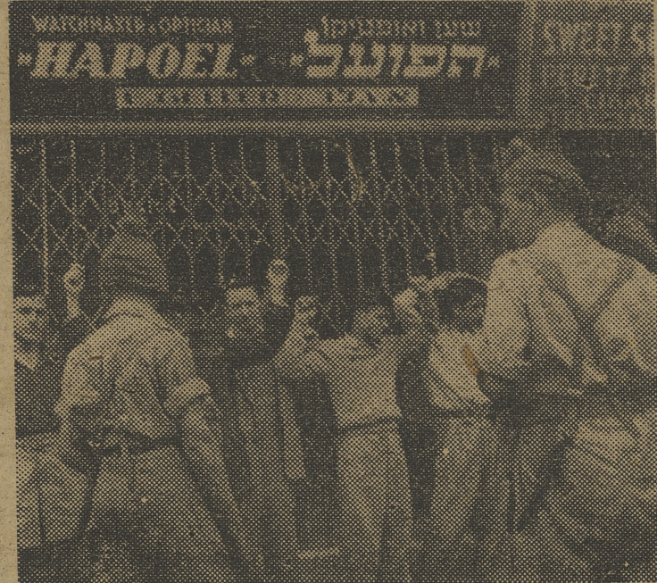
En las calles de Jerusalén se repiten, con frecuencia, escenas como ésta, en que la policía británica cachea y pide documentación a personas sospechosas de actividades terroristas.