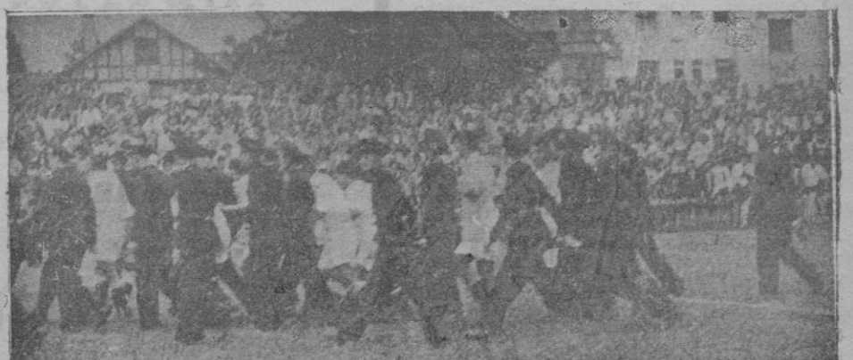
En esta forma, fuertemente custodiados por los guardias de Asalto tuvieron que abandonar el campo los jugadores del Sevilla, en Pamplona, porque el público les agredió a pedradas y botellazos