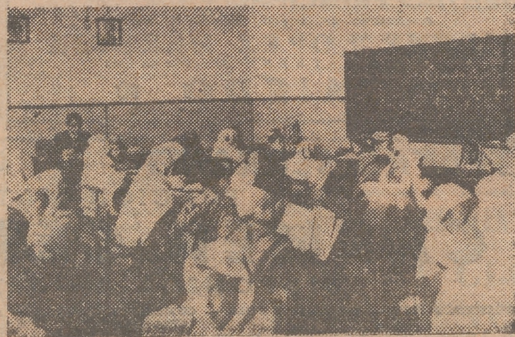
Vista de una escuela primaria musulmana en Alcazarquivir