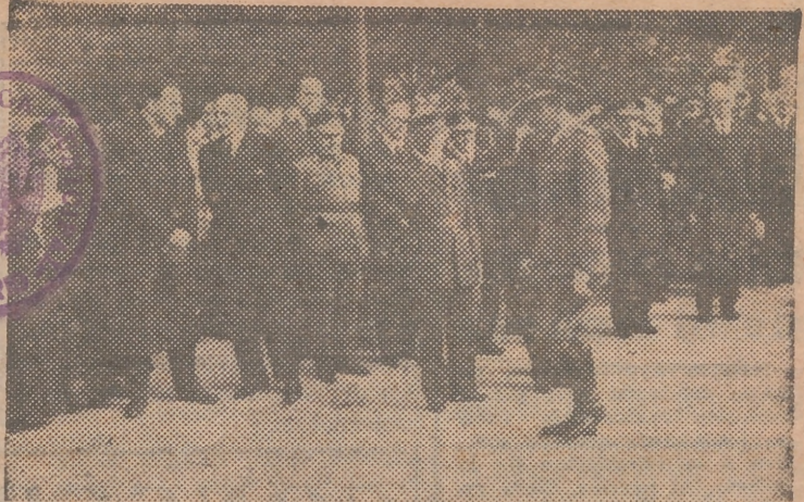
MADRID.—El general González Gallarza, acompañado de los ministros del Gobierno, recibe el pésame de las personalidades que asistieron al entierro de su esposa

Entierro de la esposa del ministro del Aire