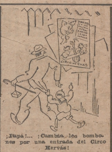
¡Fápá!... ¡Cambia los bombones por una entrada del Circo Hervás!

CROUS Colón, 50. — Teléfono 14.182 DEFENSA DE ASEGURADOS