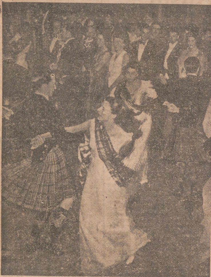
La princesa Isabel, llevando un tartán escocés sobre su traje, bailando una danza escocesa en Grosvenor House, durante el Royal Caledonian Ball