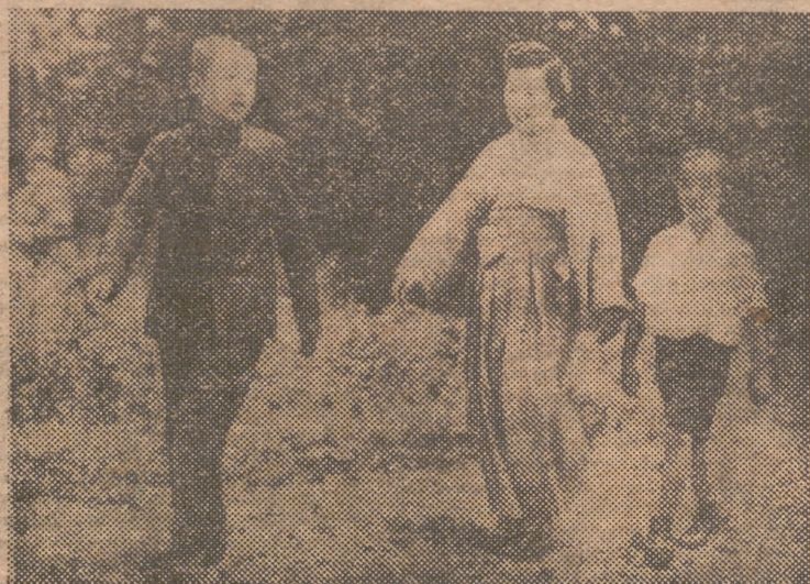
La emperatriz del Japón, acompañada de sus dos hijos, el príncipe heredero Akihito (izquierda) y el príncipe Yoshi, visita la escuela de los Padres de Koganei, situada en las afueras de la capital.

Los mejores muebles son los muebles de Muebles GRANERO Convento de Santa Clara, 8 (travesía de Ribera) VALENCIA