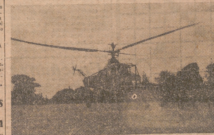
Un importante nuevo uso para el helicóptero, en razón de la poca velocidad y gran sustentación que puede desarrollar, es la fumigación de los campos. Este aparato ha sido construido por «La Cierva Autogiro Company»

Un cartel provoca una discusión en los Comunes