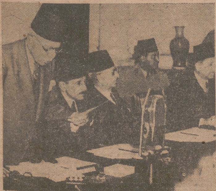
EL CAIRO. — Con el fin de tratar más ampliamente de la propuesta británica de abandonar Egipto, una delegación británica, presidida por lord Stansgate, se ha reunido con una representación egipcia que presidió el primer ministro de Egipto, Sidky Paohá. En la fotografía: El primer ministro egipcio, Sidky Paohá, se dirige a los delegados durante la reunión. — (Foto Cifra)