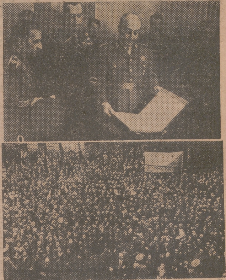
OVIEDO.—S. E. el Jefe del Estado examina el álbum que le dedicaron los obreros de la fábrica de armas La Vega. La multitud aclama al Caudillo en la plaza del Ayuntamiento de la capital asturiana.