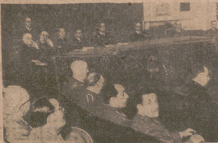
MADRID.—El ministro de Agricultura ha presidido en la Universidad Central, el primero de los actos conmemorativos del centenario del botánico español don José de Cavanilles, actos a los que asiste una distinguida representación portuguesa.