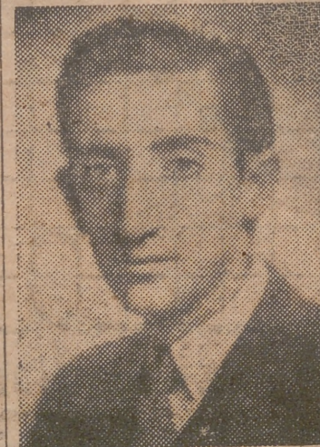
de la línea aeropostal venezolana, que hace el viaje director desde Maiquetiá a Lisboa.

Berlín, 23.—El Servicio de Información británico en Alemania anuncia que la policía berlinesa ha detenido en el distrito de Neukoelln a trescientas personas, veinticinco de las cuales se cree pertenecen a un movimiento de resistencia clandestino.—Efe.