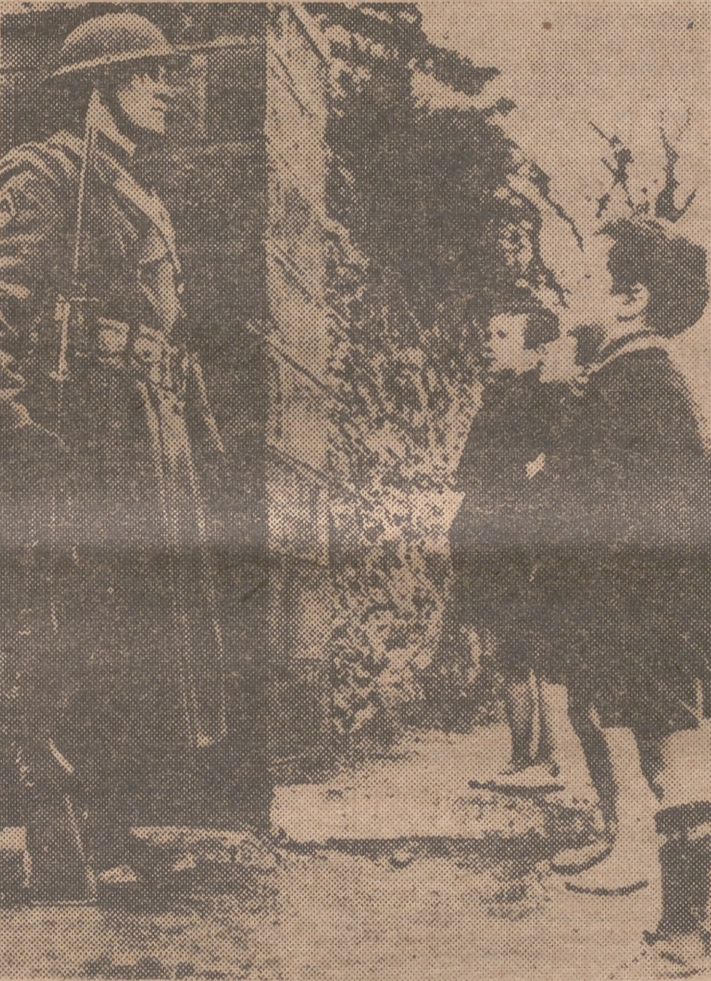
Estos niños irlandeses contemplan, admirados, a un soldado británico.