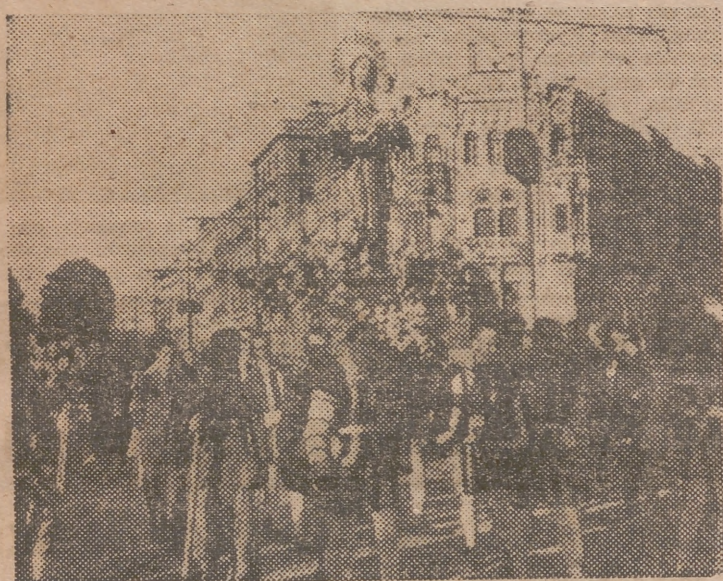
Un momento de la solemne procesión.

Al regreso del cortejo religioso el templo, que estaba profusamente iluminado, y en el que ya no cabían más fieles, se cantó el «Tota pulchra» y pronuncióse por el padre director del rosario, una piadosa oración alusiva al piadoso acto que se acababa de realizar.