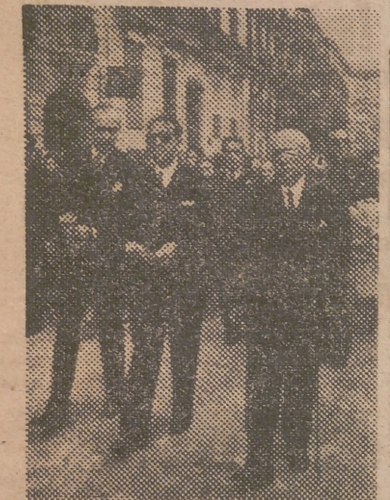
El jefe provincial y gobernador civil, con el alcalde, presidiendo la procesión de la Rosa

Cada año reviste mayor esplendor la solemnisima fiesta de la Rosa, en el primer domingo de mayo, que celebran la comunidad