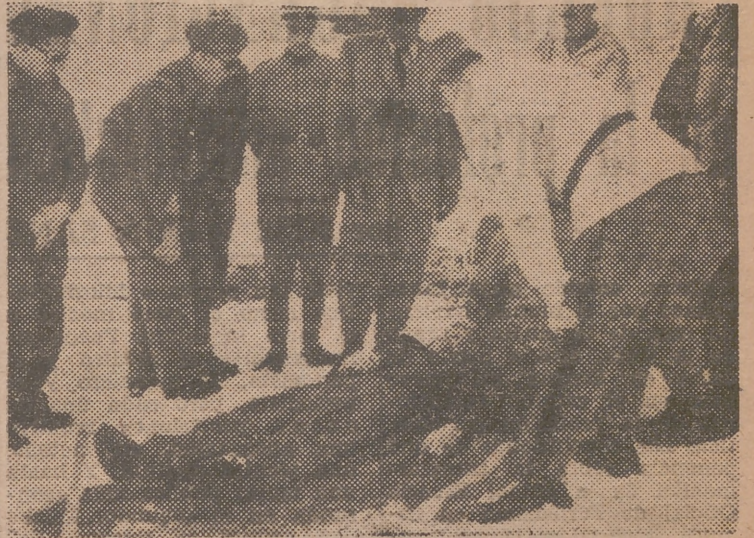
El Canadá se interesa por los servicios de montaña del Ejército suizo, por lo que ha enviado al país helvético una delegación militar, que, en la fotografía asiste a las pruebas de salvamento de un herido en la nieve.