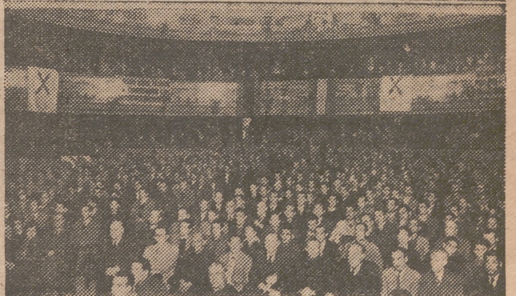
Los instantáneas del magnífico acto que se celebró el sábado último en el teatro Principal, con la intervención del delegado nacional de Sindicatos