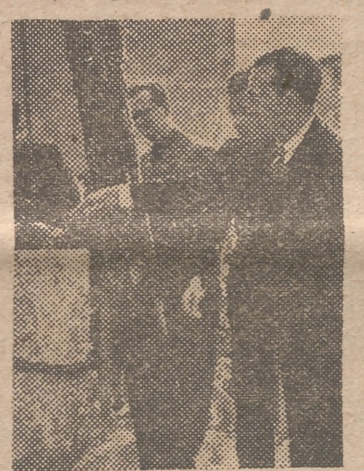
El delegado nacional de Sindicatos coloca la primera paletada de arena en las obras del nuevo edificio-escuela de Turis