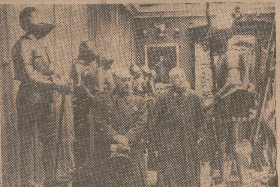
S. E. el Jefe del Estado, Generalísimo Franco, inaugura cinco nuevas salas del Museo del Ejército.