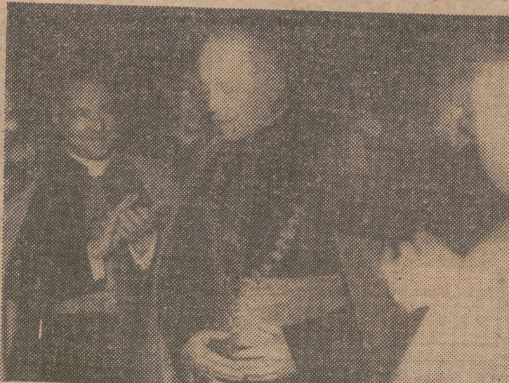
El cardenal Tedeschini recibe, en Roma, el Gran Collar de la Orden de Carlos III, ofrecido por el Gobierno español.