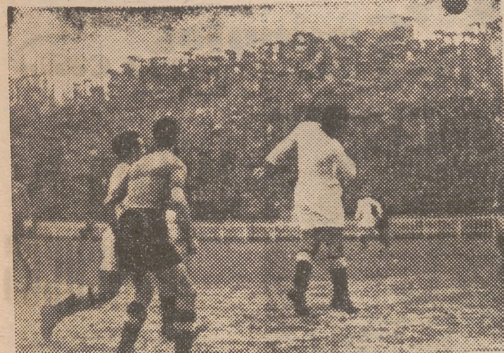
Ayer reapareció Mundo en las filas blancas. Y aunque creó muchos peligros ante la meta del Madrid no tuvo el acierto necesario para encontrar la brecha y perforar la puerta de Marín, a pesar de cabezazos como el de la foto

de que siete días antes de que llegara a Mestalla el señor Quincoces y sus muchachos ya se habían perdido las esperanzas de trepar a lo alto del escalafón liguero, siempre resulta doloroso y triste ver cómo los forasteros aprovechan la visita para cargar con un punto «doméstico», de esos que, sobre el papel, deben quedar siempre a beneficio de la localidad. Se perdió otro punto en casa. Como los dos que se perdieron frente al Barcelona. Y los otros dos que se llevara el Atlético vasco. En total: cinco puntos perdidos en Mestalla. Precisamente los que nos hacían falta para situarnos en el primer puesto de la tabla, por encima de asturianos, bilbaínos, catalanes, madrileños y demás competidores. ¿Qué se le va a hacer! Está visto que el Valencia de esta temporada