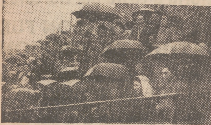
Y lo demás, son cuentos. Porque aguantar la tardecita del domingo y después soportar el empate, es propio de valientes. Y hablando de estoicismo. El público salió del campo con una cara como la de «Manolete». Que es una cosa seria cuando está serio