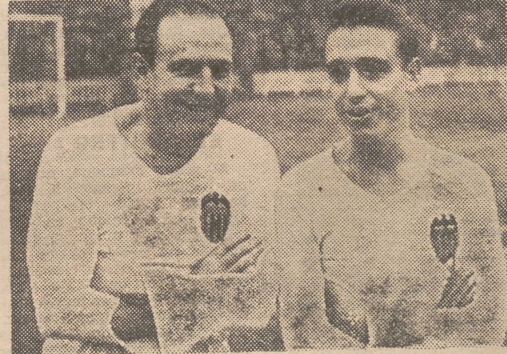
El Valencia estrenó ayer un ala nueva. La de Rubio-Gorostiza. Y justo es decir que la alineación de los «chavales» no defraudó. Aunque el resultado no fuese satisfactorio

de que siete días antes de que llegara a Mestalla el señor Quincoces y sus muchachos ya se habían perdido las esperanzas de trepar a lo alto del escalafón liguero, siempre resulta doloroso y triste ver cómo los forasteros aprovechan la visita para cargar con un punto «doméstico», de esos que, sobre el papel, deben quedar siempre a beneficio de la localidad. Se perdió otro punto en casa. Como los dos que se perdieron frente al Barcelona. Y los otros dos que se llevara el Atlético vasco. En total: cinco puntos perdidos en Mestalla. Precisamente los que nos hacían falta para situarnos en el primer puesto de la tabla, por encima de asturianos, bilbaínos, catalanes, madrileños y demás competidores. ¿Qué se le va a hacer! Está visto que el Valencia de esta temporada