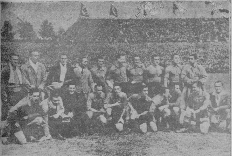
El equipo español que venió al alemán, en Colonia

Se vende embarcación de 26 palmos, a vela y motor. Informes Paz, 12, 1.º