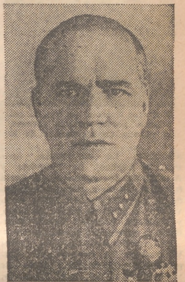
Zukov, que, como enviado de Stalin, estuvo en Madrid durante la guerra española. Planeó y dirigió las operaciones de los rojos. Se demuestra, pues, que nuestra contienda civil fué un asunto de Moscú

Poder, para Molotov. Un tercero en discordia, y quizá el vencedor, sea este mariscal George Zukov, quien parece poseer, a medias, la confian-