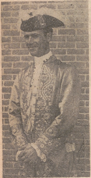
Murteira Correia, el famoso caballista portugués que actuará el sábado en la corrida de la Prensa

atractivos. La reaparición, ante nuestro público, de Manolete y Arruza, los dos colosos de la fiesta nacional. Junto a ellos, completando el magnífico cartel, Pepe Bienvenida, el brillante torero sevillano, y Murteira Correia, famoso caballista y rejoneador portugués.