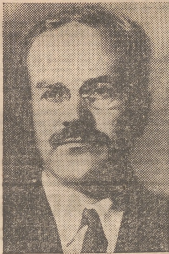
Molotov, para quien el partido comunista reclama todo el poder

No obstante, tomemos con caute las pinzas esos rumores: Stalin, a lo largo de su sangrienta carrera, ha demostrado con sus históricas pugnas que es capaz de ir liquidando mariscales generales e incluso la Plana Mayor completa de su Ejército, junto con miles de amigos y correligionarios. De momento oficialmente, Stalin no está enfermo; al revés, más vivo que nunca, según prueba el relato que de una reciente entrevista con el dictador soviético hace hoy en la Prensa norteamericana el senador Claude Pepper. Este político yanqui habló el 14 de septiembre con Stalin, y Stalin le dijo que los fines de la Unión Soviética sólo buscar la amistad con los Estados Unidos, mano dura contra el Reich y el Japón, amputación de la región del Ruhr de la nueva Alemania y un nue-