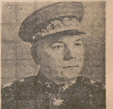
Vorochilov, uno de los candidatos a la sucesión de Stalin, según los rumores a que se alude en esta crónica. Cuenta con el apoyo del ejército ruso

Volviendo al rumor de la actualidad inmediata, anotemos que algunos comentaristas yanquis conceden importancia o significación política a este viaje de Zukov, pues se especula aquí mucho sobre una real o supuesta parálisis progresiva de que dicen padece Stalin, enfermedad —añaden— que muy pronto le obligará a dimitir el Poder. Estos comentaristas aducen que el reemplazamiento de Stalin puede originar terribles luchas intestinas o públicas en Rusia, ya que el Ejército rojo, victorioso, exige que el sustituto salga de sus filas y sea el mariscal Vorochilov, en tanto que el partido comunista reclama el Poder, todo el