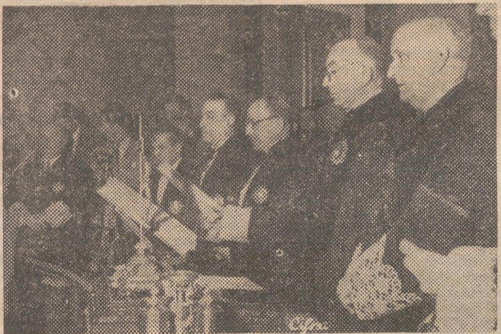
En el Palacio de Justicia de Madrid, ha tomado posesión de su cargo el nuevo presidente del Tribunal Supremo, señor Castán Tobeñas.