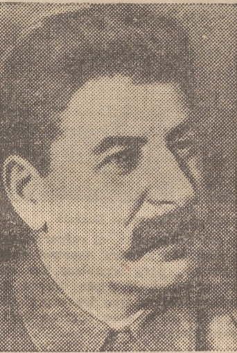
Stalin, oficialmente, está más vivo que nunca. Pero se rumorea que se verá obligado a abandonar el poder porque padece una parálisis progresiva

Como posibles sucesores, se cita los nombres DE MOLOTOV, VOROCHILOV Y ZUKOF