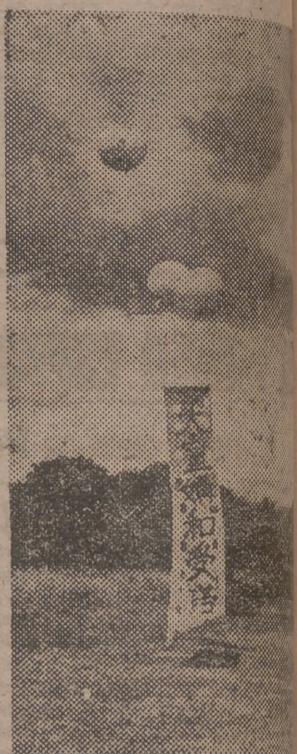
Globos, de los que cubren flámulas, notificando la noticia incondicional del Japón, son lanzados por fuerzas americanas sobre la zona, para avisar a las fuerzas enemigas que aún persisten en las montañas de Sierra Madre