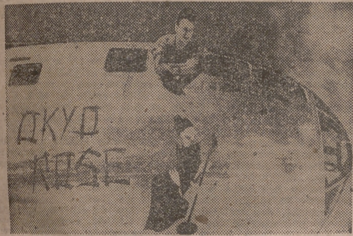
El primero que voló sobre Tokio fué el capitán Ralph D. Steakley, que aparece en su fortaleza volante, adornada con una caricatura nipona. — (Foto Cifra).

Castán: «Jurisprudencia Civil» (tomo VII, junio-septiembre 1944), 30 pesetas.—«Leyes de 4 de julio y 8 de octubre de 1932 sobre accidentes del trabajo en la industria», conteniendo el reglamento y todas las reformas introducidas hasta agosto de 1945. 10.—Aparicio Ramos: «La falstad en la letra de cambio», 18.—Vidaurreaga: «Algebra Financiera», (2.ª edición), 60.—Navas y Ruiz del Clavijo: «Tratado de Fisco general», 80.—Box: Apéndice a las «Contestaciones» para médicos de la Marina civil, 60.—Dichos libros y todos los que usted necesita puede adquirirlos, al contado o a plazos, en el «INSTITUTO EDITORIAL REUS», S. A. Preciados, 23 y 6, MADRID.