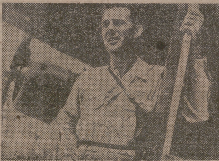
El coronel John S. Leckey, bajo el ala de su avión, momentos antes de despegar hacia el aeródromo de Atsugi, donde 150 técnicos de comunicaciones y aviación aterrizaron el 27 de agosto