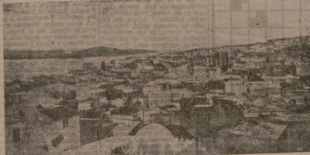
VISTA GENERAL DE TANGER

Y a todo esto, kilómetros y kilómetros por campos perdidos, donde sólo encontramos al labriego en paz con su carga de trabajo o de fruto. Nos entramos risco arriba por la Peña de Francia y vemos que desde todos los lados de la provincia, la gente Ciudad Rodrigo y de Béjar, los albercanos, alguno de los cuales lleva su traje típico con doble hilera de botones de plata, avanzan hacia la Peña para rendir a la Virgen de la cumbre el homenaje de su devoción. Arriba, en la explanada, el espectáculo es indescribible. Alegría ruidosa y cordial de pueblo libre. Danzas típicas al son de tamboril. Procesión de la Virgen llevada en andas, al son de canciones ingenuas y primitivas, por los caminos de la montaña, mirando a los valles inmensos. Sin comentarios de los que no hay por qué hacer, de los que irán haciendo solos en el interior de los peregrinos. La Virgen española ha unido con nosotros a ese grupo de extranjeros. Y la Virgen española nos ha dicho a los extranjeros muchas verdades de España.