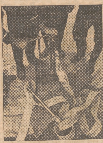
Una de las bocas del servicio contra incendios, que en gran número se están instalando en diversos puntos estratégicos de la capital

neas—, es lo primero que arde. Pero aparte de los siniestros propiamente dichos, aquí realizamos los más variados; servicios. Dejando aparte los achiques en las inunda-