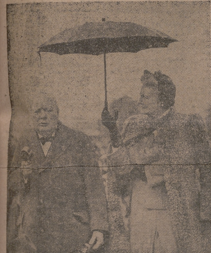
El acto inaugural de la propaganda para las elecciones inglesas, corrió a cargo de Churchill, que desde un coche y bajo la lluvia —su mujer sostiene el paraguas— se dirige a la multitud en Woodford