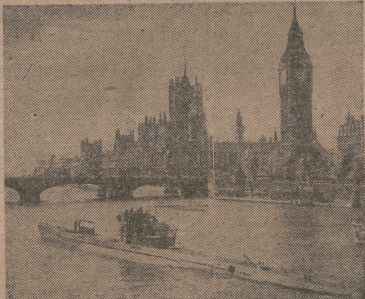
Uno de los submarinos alemanes que se han entregado, cruza el Tamesis, pasando frente a Westminster

Telefonos de JORNADA: Núms. 10.617 y 15.599