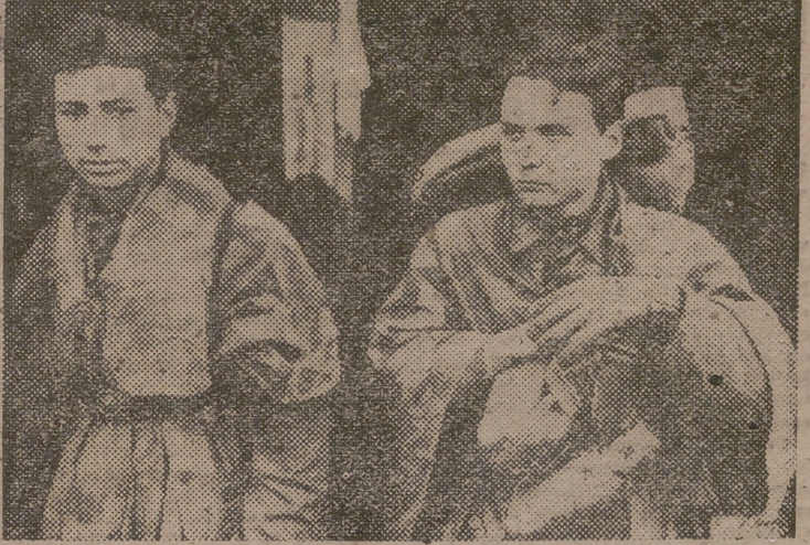
Dos jóvenes prisioneros germanos, que reflejan en su cara la tragedia actual del pueblo alemán, después de la capitulación.