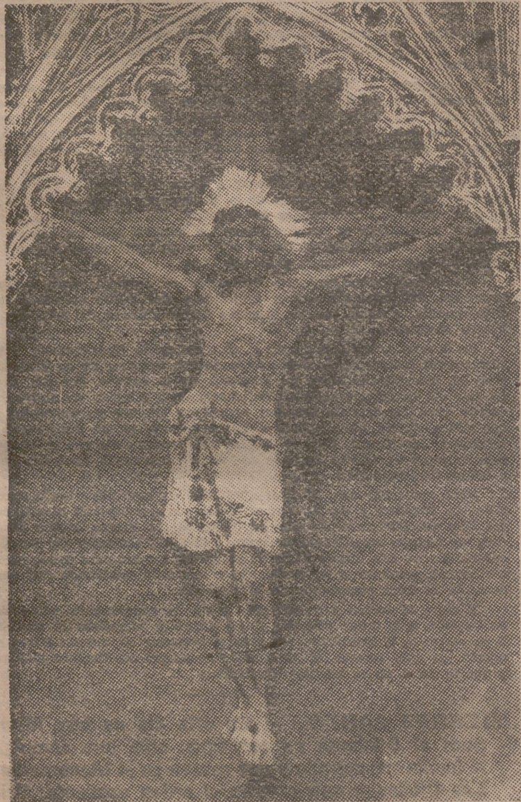
El Cristo de Lepanto, que en lo alto de la galera de don Juan de Austria, dió a los cristianos la victoria sobre la potente escuadra del turco

El que lo dió todo por el género humano tiene, en el corazón del pueblo español, la primera capilla y el primer trono.