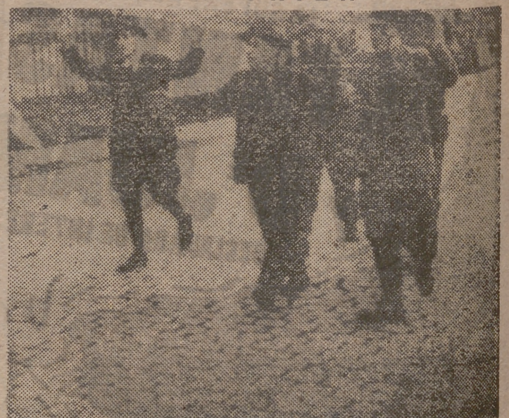
Paisanos de Trier, ciudad la más antigua de Alemania, salen de la localidad con los brazos en alto, al entrar en ella las tropas del tercer ejército norteamericano para so focal la última resistencia enemiga