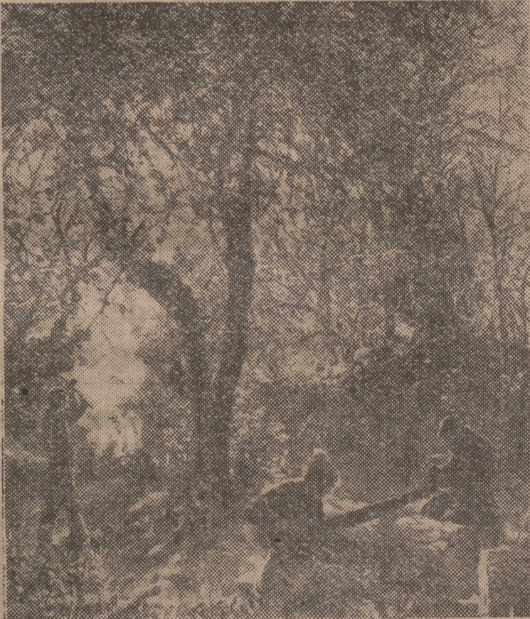
«La Maraños», lienzo de Moreno Gimeno, destinado a la Exposición Nacional de Bellas Artes de Madrid, que ha sido presentado en la Sala Mateu