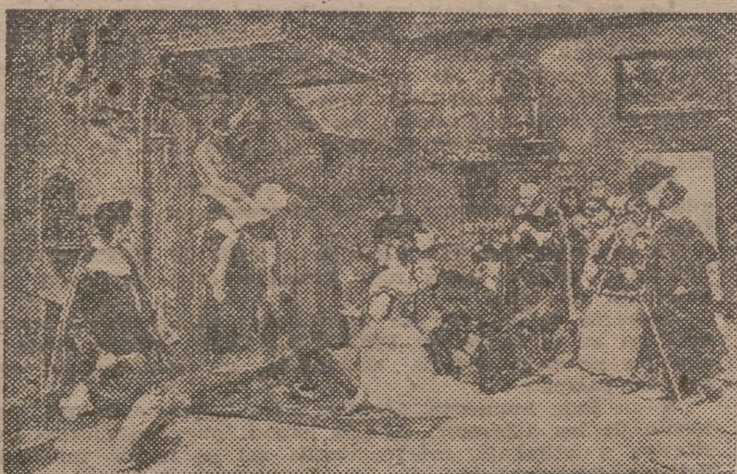
Cuadro de Menéndez Pidal, inspirado en el poema de Zorrilla: «A buen juez, mejor testigo», que rememora el prodigio del Cristo de la Vega

lona, después de presidir la cruzada española contra el turco, Marchaba en el punto más alto de la galera capitana de Don Juan de Austria, cuando éste mandaba las fuerzas navales lanzadas contra la poderosa escuadra de Ali Bajá. Apenas las huestes de la impiedad divisaron las unidades cristianas, su primera maniobra, no exenta de perfidia, fué batir al Cristo, bajo cuyos auspicios navegaban las naos del Emperador. De la misma nave que personalmente dirigía el almirante turco, dispararon bombardas contra el Cristo Santo;