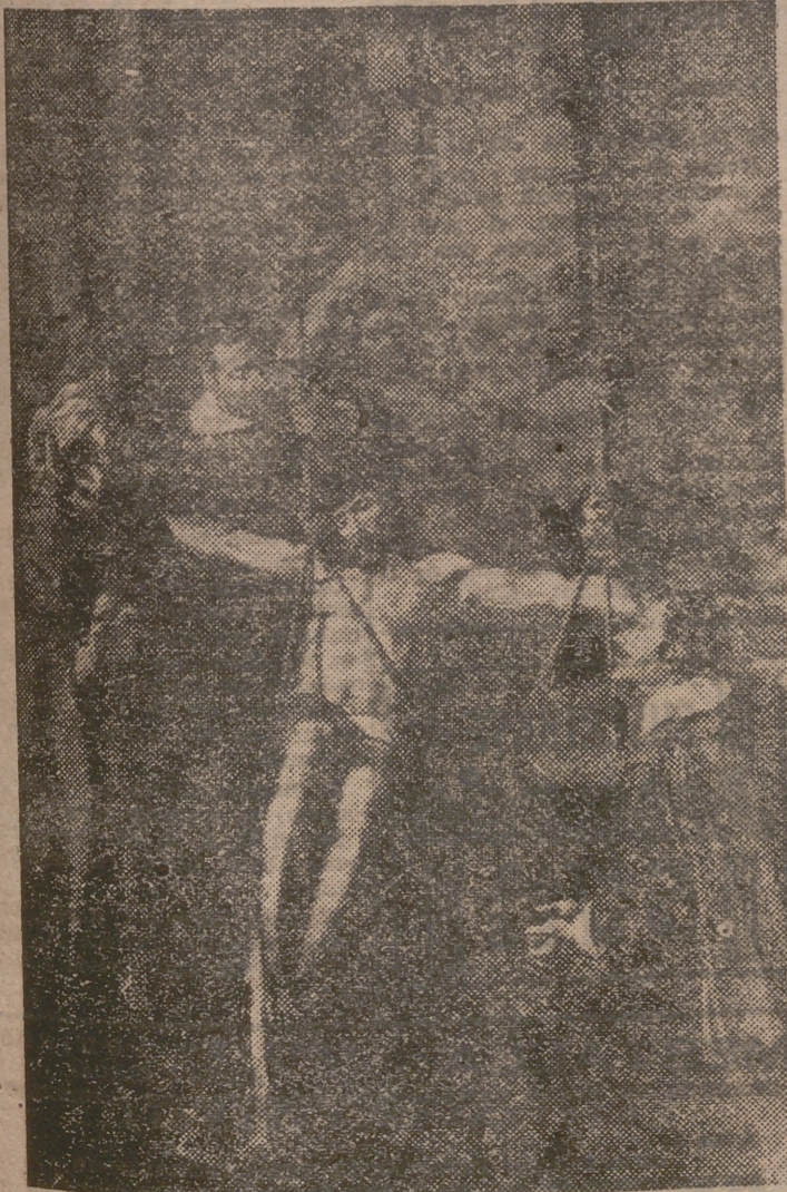
Santísimo Cristo del Rescate, ante el cual se rezará el solemnisimo Via-Cruces de Viernes Santo, en la plaza del Caudillo (Católico). No dejes de asistir, para pedir, en oración pública y colectiva, por el Papa y por la Paz. A las siete en punto de la tarde

El horroroso suceso de Manila ha venido, pues, a corroborar nuestro aserto.