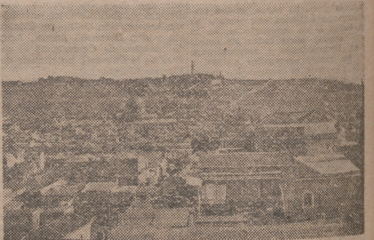
Vista parcial de Jerusalén y Monte de los Olivos

En las estrabaciones de una colina, desnudo de toda ornamentación, el sepulcro del amigo del Rabí abre su milenaria puertecilla a la orilla de un camino. Inmediata a la puerta tiene su iniciación una escalera de piedra bruta y resbaladiza que conduce a un piso subterráneo compuesto de dos departamentos; el primero, que hace oficio de antecámara mortuoria; y el