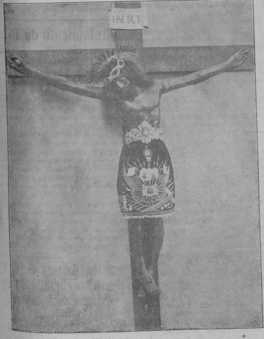
La venerada imagen del Santo Cristo de Manacor