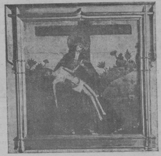
Piedad. — Tabla escuela mallorquina, siglo XV. Colección A. Mulet

Hizo referencia a las modernas teorías de Keynes, Aftolien Mackena y otros economistas que han atribuido al ahorro una influencia perniciosa en relación con la crisis motivada por la conflagración de