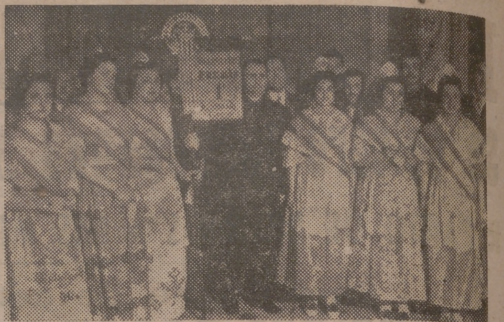
Del reparto de premios a las fallas. Entrega del primer premio a la falla del Mercado.

Todo lo mejor de nuestra sociedad se reunió anoche, junto a numerosos jefes y oficiales del Ejército, y a nuestras primeras autoridades y jerarquías que con su presencia dieron al festejo que en honor de la Fallera Mayor y su corte se celebraba, un inusitado esplendor.