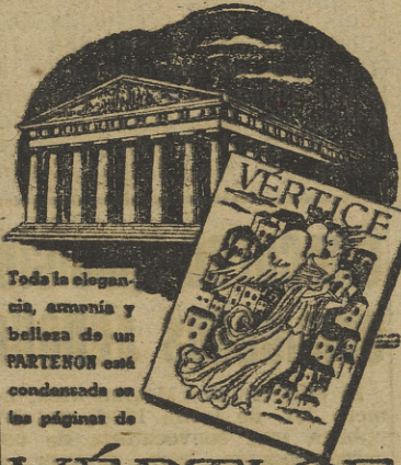
Toda la elegancia, armonía y belleza de un PARTENON está condensada en las páginas de