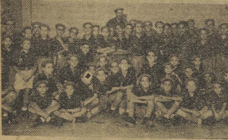
Ayer efectuaron una visita al jefe provincial, las escuadras premiadas en los Campamentos del F. de J.

VISITA DE CAMARADAS DEL F. DE J. AL JEFE PROVINCIAL