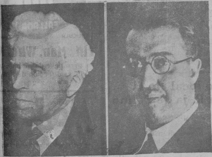
Don Manuel Portela Valladares, nuevo ministro de la Gobernación