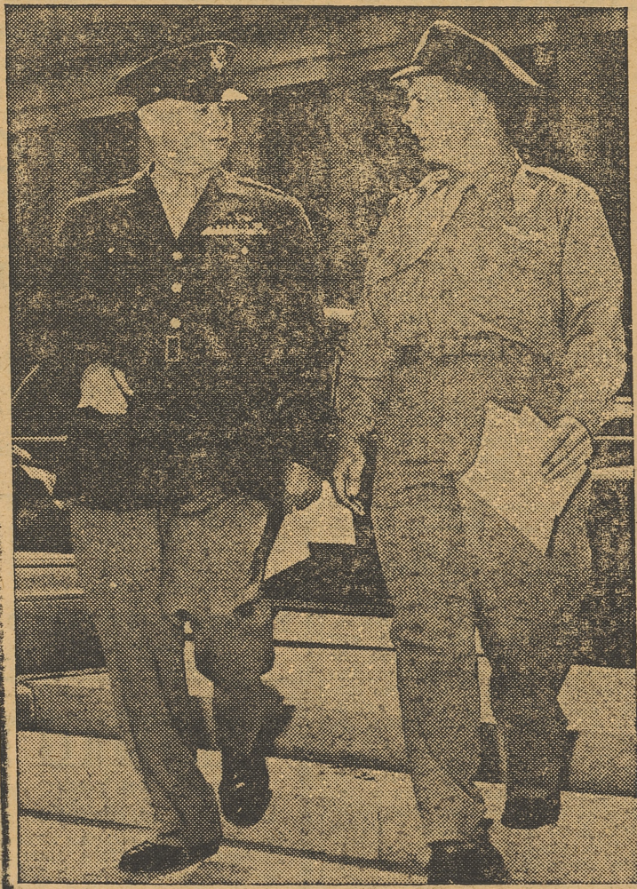
El general Henry H. Arnold (izquierda), jefe de las fuerzas aéreas del Ejército norteamericano, desciende las gradas del edificio pentagonal del Departamento de Guerra en Washington, junto al comandante Richard I. Bong, «as» americano del aire en el Sudoeste del Pacífico, que ha derribado 27 aviones japoneses en combate