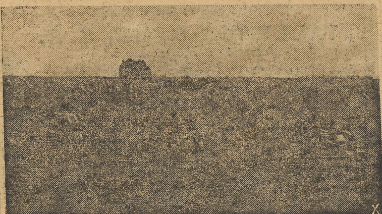
Carros alemanes se dirigen al lugar de la acción durante un contraataque de las fuerzas del Reich en la cabeza de puente de Normandía.