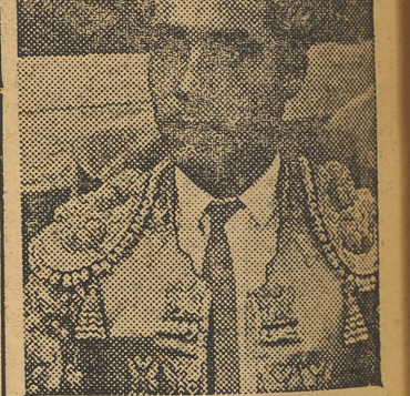
embistan mucho para poder complacer a mi público. ¡Valencia III, por Valencia, la primera!