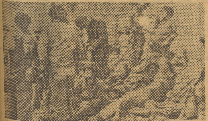
Tropas norteamericanas descansando en el Norte de Francia.

La tesis más autorizada parece ser esta última, porque intentando rehacerse en el territorio de la antigua Polonia — donde es presumible que se habrán levantado líneas fortificadas, pues tiempo para ello ha habido —, los alemanes dispondrán todavía de algún espacio para sus maniobras. Por otro lado, la presencia de divisiones de refresco — no señalada hasta el sábado — en las inmediaciones de los centros de gravedad de los ataques actuales, apoya la creencia de que, efectivamente, en Polonia central van a librarse los combates más violentos y decisivos del verano de 1944.